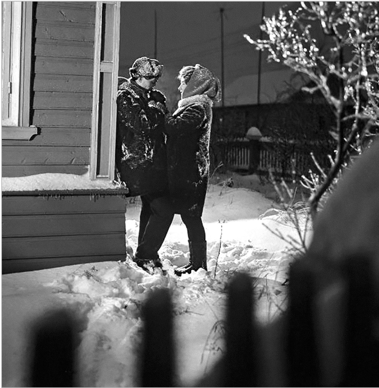
Это было недавно?.. Фото из серии «Романтика советской эпохи».

Многие люди с трепетом ожидают наступления Масленицы, традиции празднования которой уходят корнями в глубь нашей истории. Сегодня, как и в былые времена, этот праздник встречают с размахом, с песнопениями, танцами и конкурсами.