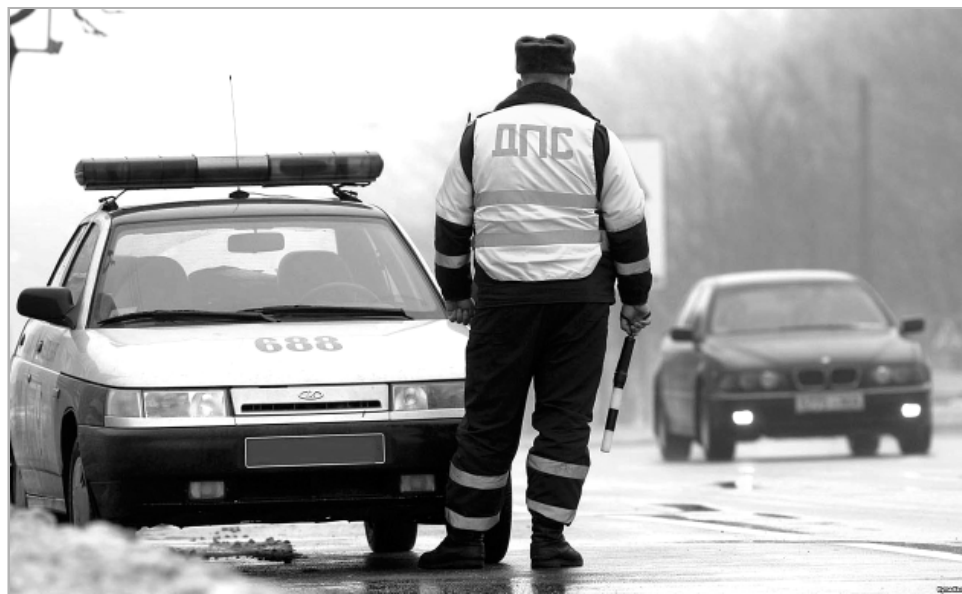
Так что у нас там с ручником?

Мероприятие проводится в целях обеспечения безопасности дорожного движения, проведения индивидуально-профилактической работы с водителями, осуществляющими проезд по железнодорожному переезду.