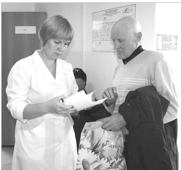
После посещения каждого специалиста автопоезда «Здоровье» пациенты получали подробные рекомендации для своего лечения.

Люди, страдающие гипертонией, сахарным диабетом, заболеваниями щитовидной железы, ишемической болезнью сердца, перенесшие инсульт, не отказывались от возможности посетить специалистов, не выезжая в краевые клиники. Многим пациентам было скорректировано лечение. В случае необходимости получали направления на дообследование или госпи-