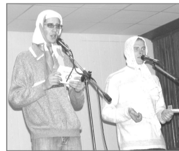
К «анти табакокурению» студентов призывали новые русские бабки.

Ольга КАЗНАЧЕВА.