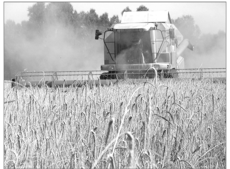
Только из здоровых семян можно получить хороший урожай. Поэтому не стоит пренебрегать полным исследованием семенного материала.

В моей практике случалось немало курьезов с непроверенными