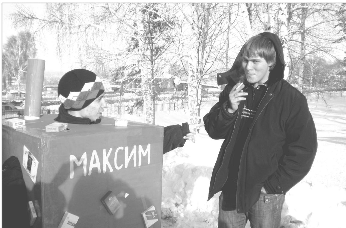
В наше время курят везде: на улице, дома, в гостях, на работе. . . . И это считается нормальным, привычным явлением. Курят не только взрослые, но и дети, не прячась от других, не скрывая этого.

Учащиеся 5-7 классов устроили суд сигарете. На нем все было по-настоящему: обвинение в причинении вреда здоровью и защита обвиняемого. В конце концов, сигарету приговорили к изгнанию, так же как и вредные привычки.