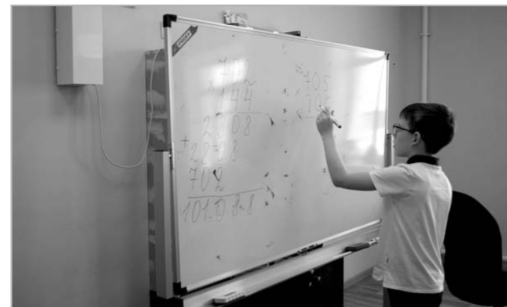
Кабинеты обустроены, как в школе. Дети работают за партами и выходят отвечать к доске.

С понедельника начальные классы ТСШ №2 начали заниматься в детском саду «Родничок». По три класса в три смены учатся в корпусе на ул. Л. Толстого и по два класса в три смены — на Московской. Мы побывали в корпусе на Л. Толстого и увидели помещения, в которых расположились классы. Кабинеты большие, светлые. Из школы привезли мебель: столы, стулья, доски.