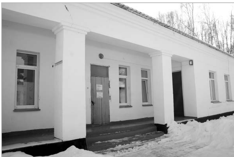
Центральный вход в корпус №2 Троицкой ЦРБ.