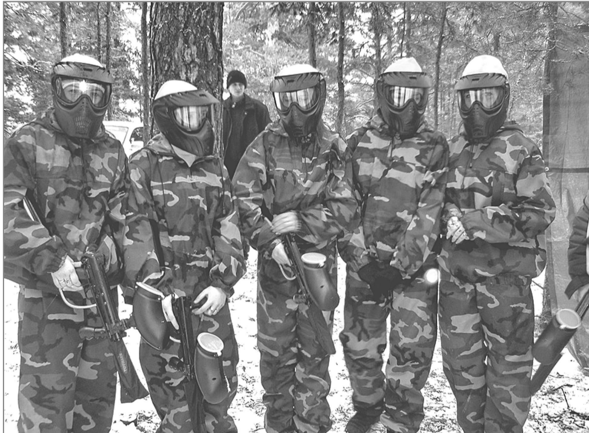
Участников соревнований не узнать! Это наша команда перед стартом.