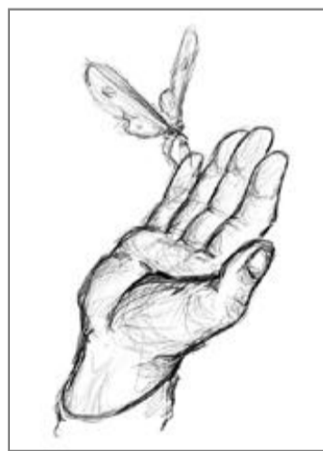
«Бабочка». Рисунок Данила Чигирева.

—Спрошу прямо: считаешь ли ты себя талантливым?