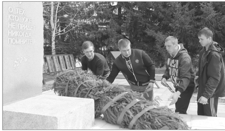
В конце торжественного мероприятия, по уже устоявшейся традиции, призывники возложили цветы и гирлянды к мемориалу.

В зал под маршевую музыку и аплодисменты входят призывники,