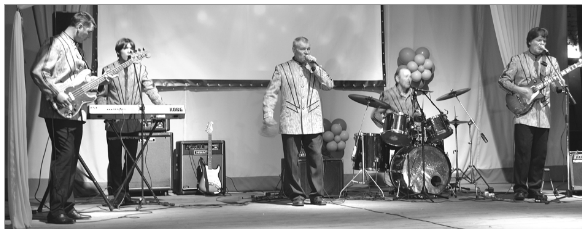
Народный вокально-инструментальный ансамбль «Добрый вечер».

КОНЦЕРТНАЯ ПРОГРАММА «Мой Троицкий район – ты капелька России», подготовленная тройчанами, была очень интересной. Зрители горячо поддерживали гостей, и, несмотря на то, что зал был неполным, аплодисменты звучали громко и восторженно.