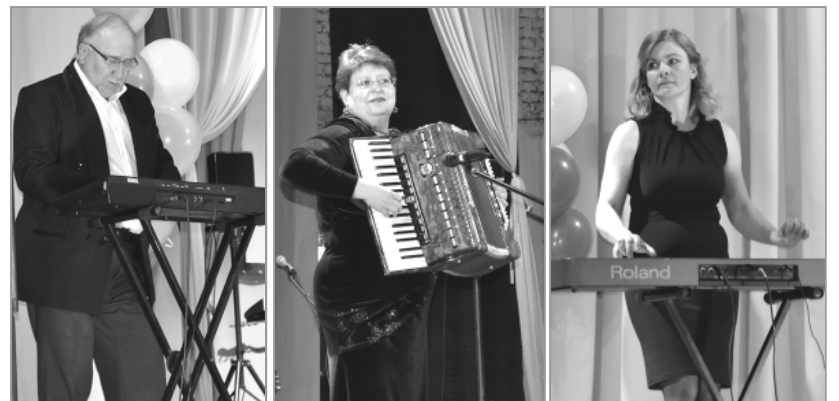
Народный эстрадный ансамбль «Родник».