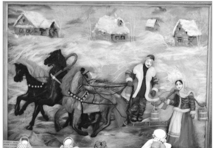
Представленная на выставке картина Анастасии Лех в технике валяния из шерсти поражает точностью переданного зимнего деревенского пейзажа – вдаль виднеются дома, и ощущается холод морозного вечера.