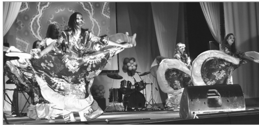
Хореографический ансамбль «Модерн» удивил зрителей оригинальностью танцев и разнообразием ярких костюмов, заставлял следить за каждым движением.