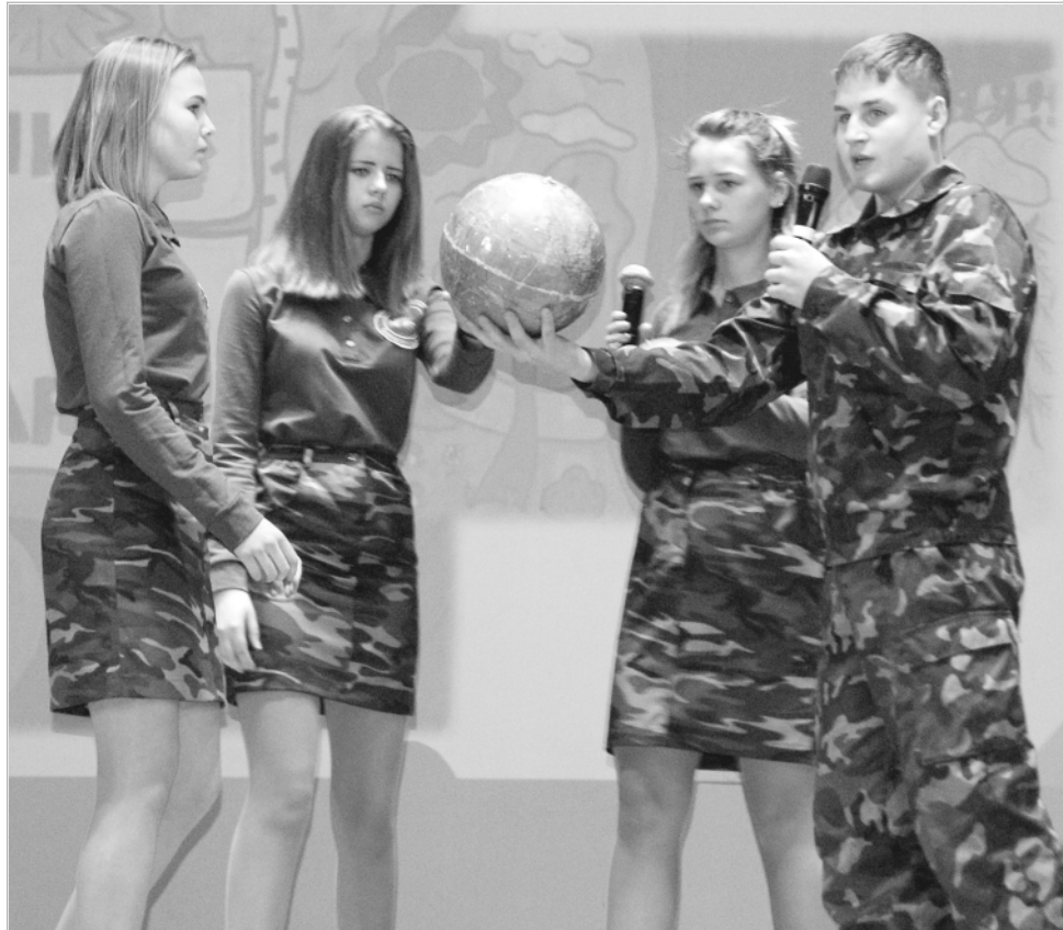
Будущее планеты Земля во многом зависит и от таких ребят, как члены школьного лесничества «ЛесСпецНаз» (Боровлянка). Они доказывают это реальными делами: очистка леса от всевозможного мусора, участие в посадке саженцев.