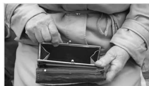
Поездка в Троицкое для жителей сел, где нет автобусного сообщения с райцентром, обходится в круглую сумму...

В Загайново с наступлением холодов вот уже не первый год остро стоит проблема водоснабжения. В селе две башни, одна из которых за-