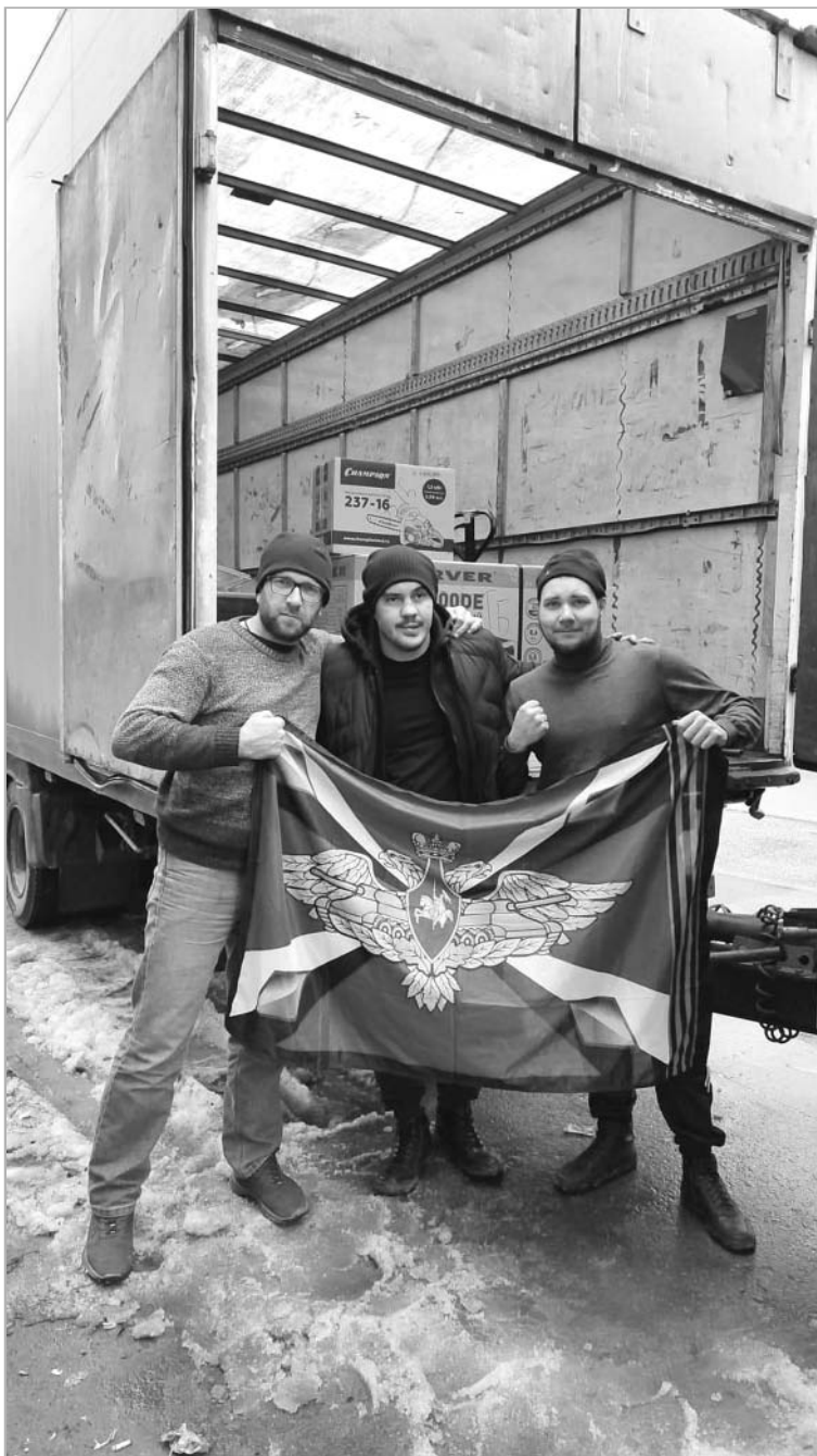
Передача гуманитарного груза, собранного участниками «Танкового братства Алтая», в зону СВО.