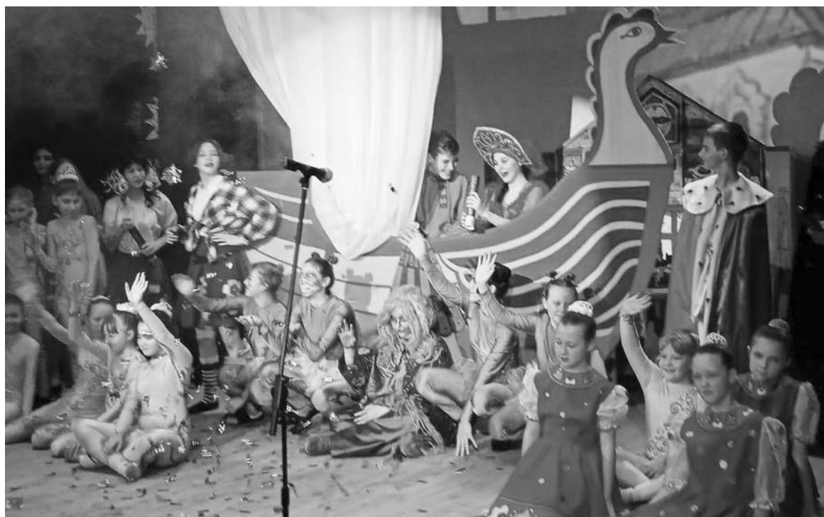
Сцена из новогоднего спектакля творческого коллектива «Театр М» Троицкой ДШИ «Летучий корабль», премьера которого состоялась 24 декабря.