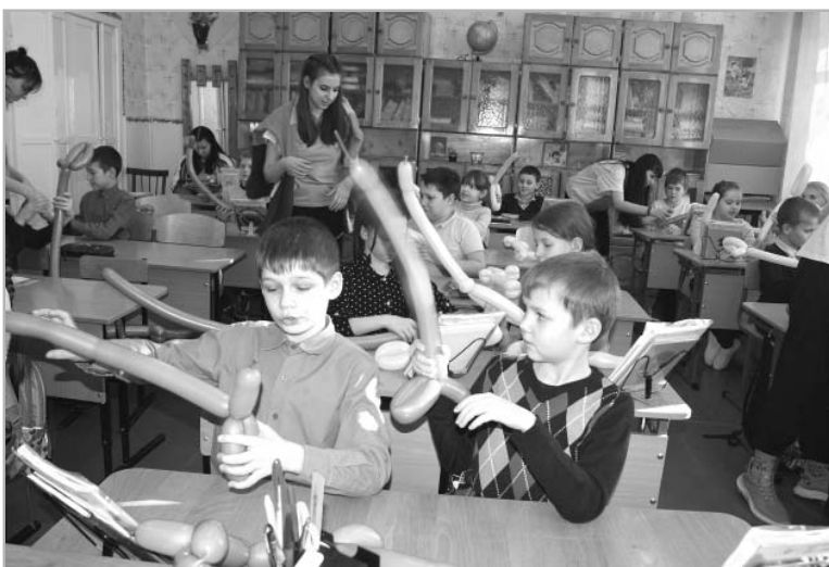
А в младших классах — мастер-класс по твистингу.