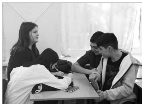
В старших классах (на снимке — ученики ТСОШ №2) студенты провели игру на тему Великой Отечественной войны. Над некоторыми вопросами школьникам пришлось поломать головы.