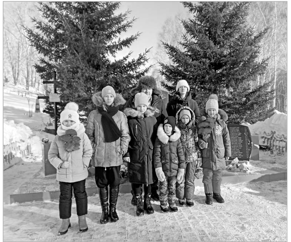
В память о детях блокадного Ленинграда ребята из Вершининской школы возложили цветы к мемориалу.