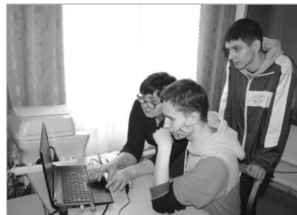
Учителя Зеленополянкой школы, что называется, пользуясь случаем, попросили студентов помочь разобраться в компьютерных программах.