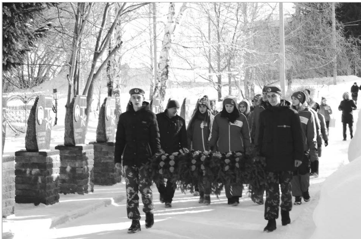
В селе Троицком приезжие студенты вместе с юнармейцами возложили гирлянду к памятнику павших воинов.

Ночевали мы в «Старте», где было очень тепло, даже можно было