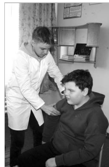
Знания, как оказать первую помощь в быту, могут пригодиться в жизни. Бойцы наглядно показали, как нужно накладывать жгут, что делать при ожогах и обморожениях, выдали еще много полезной информации.

спать без спальников. Еще один немаловажный момент и приятный бонус — в спорткомплексе можно было воспользоваться душем. От всего отряда говорю большое спасибо за организацию питания, никто не остается голодным. Кормят — супер!