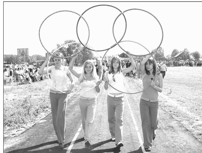
Уровень подготовки и проведения соревнований в Боровлянке был достаточно высок.

«Досадно, что не выставили команды, которые победили в отборочных соревнованиях, две администрации – Ереминская и Хайрюзовская, но еще более досадно, что главы Гордеевской и Ельцовской администраций вообще про-