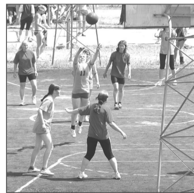
А сколько ярких мгновений олимпиады осталось за кадром!