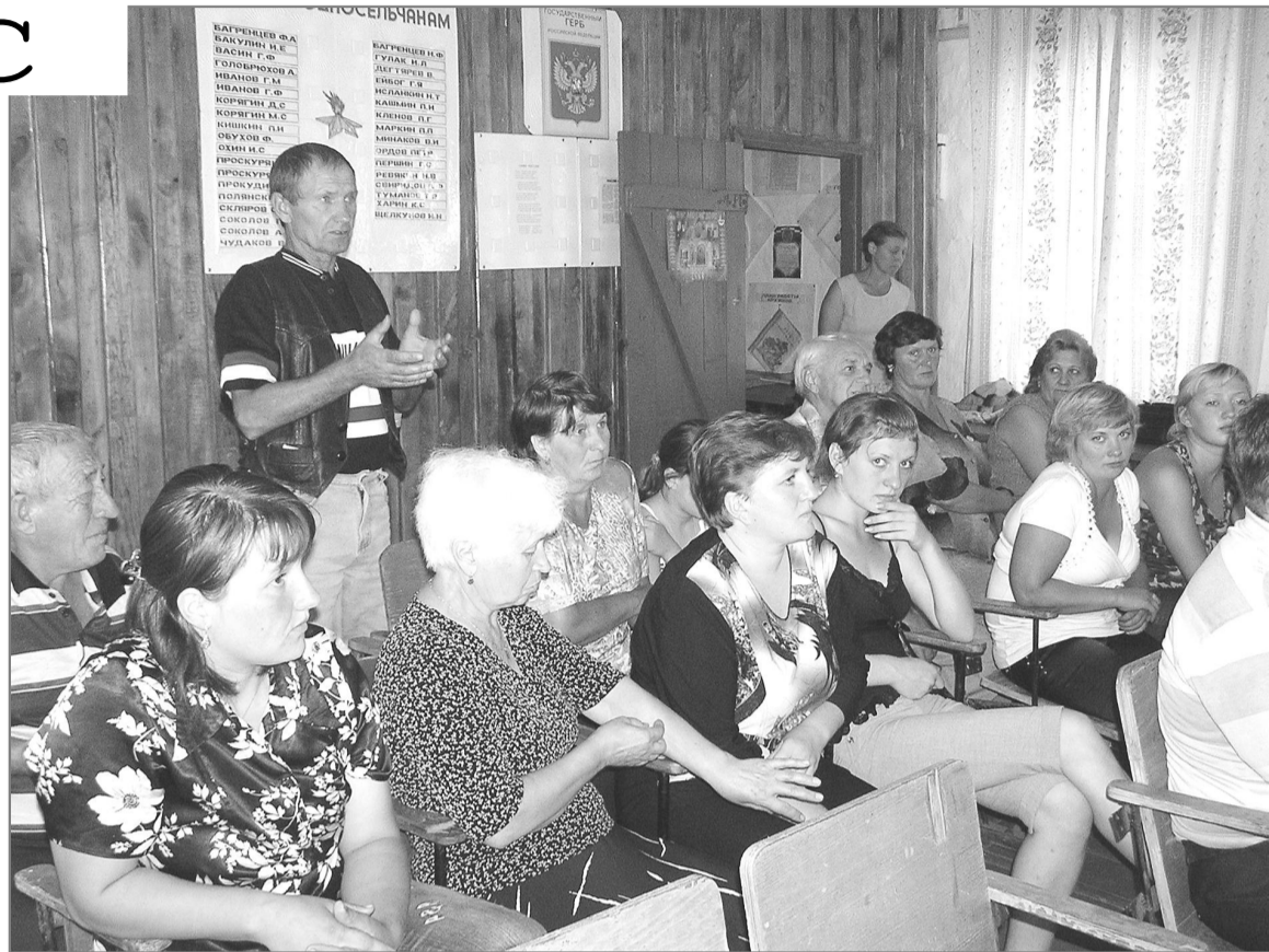
На встречу с главой Клюквенцы пришли, чтобы задать вопросы, которые волнуют и жителей других сел района. Не обошлось и без обсуждения проблем, касающихся только Клюквенного.