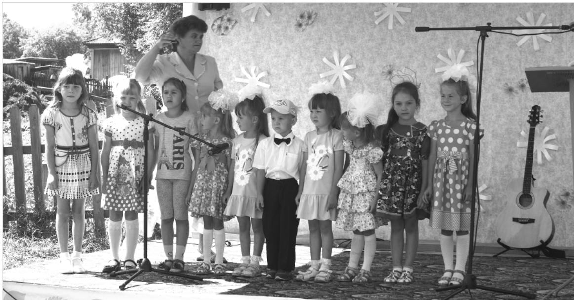
Петровская детвора приняла активное участие в дне села. Пели и рассказывали стихи не только местные, но и приезжие ребята, которые гостят у дедушек и бабушек.