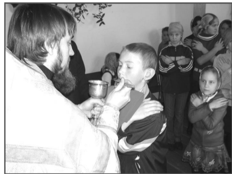
Многие воспитанники воскресной школы приняли Причастие Духа Святого во второй раз в жизни.

нять Святое Причастие, не все знали, как надо к нему готовиться, что этому предшествуют исповедь и покаяние. А ведь покаяние в грехах – это главное, ради чего человек приходит в церковь, ради чего причащается, чтобы очистить свою душу от их тяжкого бремени.