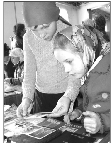
В православной лавке предлагался большой выбор детской духовной литературы.

4 декабря – Введение во Храм Пресвятой Владычицы нашей Богородицы и Приснодевы Марии Праздник Введения во Храм Богородицы установлен в память того знаменательного дня, когда Иоаким и Анна во исполнение данного ими обета посвятить Дитя Богу, привели Дочь в Иерусалимский храм и Дева Мария вступила на путь беззаветного служения Богу. Этот поступок родителей Марии Церковь ставит в пример всем верующим, указывая, что истинные христиане должны воспитывать в своих детях любовь к Всевышнему с самого раннего возраста, как только ребенок начинает понимать окружающее. Праздник Введения почитается великим, поскольку он есть предвестие Божиего благоволения к людям.