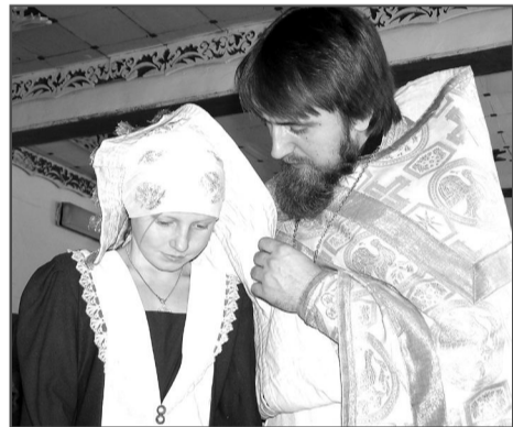
Искренне покаяться в грехах и получить разрешение к причащению – плод большой духовной работы.