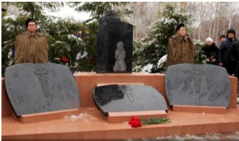
Боровлянский памятник детям блокадного Ленинграда

В августе - октябре 1942 года более 300 ребятишек из ленинградских детдомов №1, №3, №30 были эвакуированы в Боровлянку. Воспитатели и медработники, как могли, спасали изнуренных голодом и холодом ребятишек, но 88 детей умерли за полгода пребывания в Боровлянке и были похоронены на местном кладбище. Оставшихся в живых детей перевели в Петровский дом малютки Троицкого района и другие детдома Алтайского края.