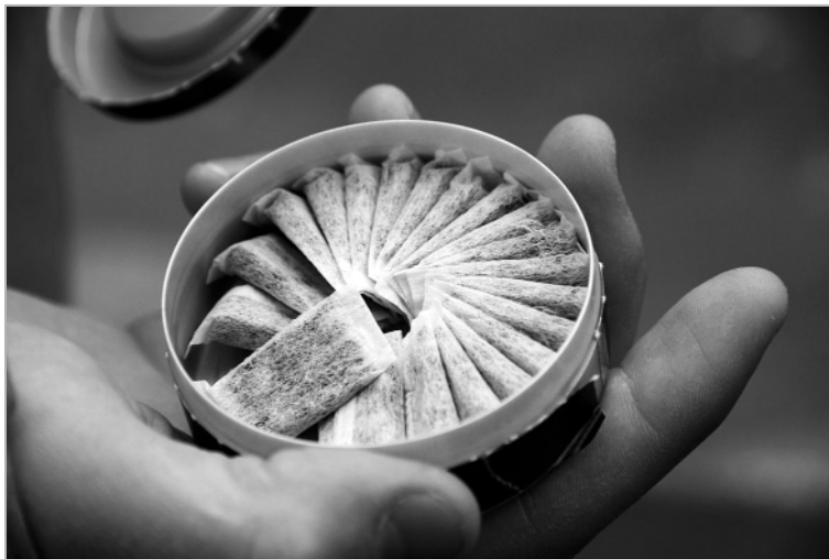
Употребляющие такие смеси подростки все чаще становятся пациентами неотложек.

Привыкание при приеме снюса возникает намного быстрее, практически молниеносно, и зависимость от никотина выражена в большей мере. Даже при попытках держать снюс во рту всего 5-10 минут в кровь поступает большая доза никотина. Попытку заменить курение сосательным табаком можно сравнить с попыткой отказаться от приема «легкого» наркотика