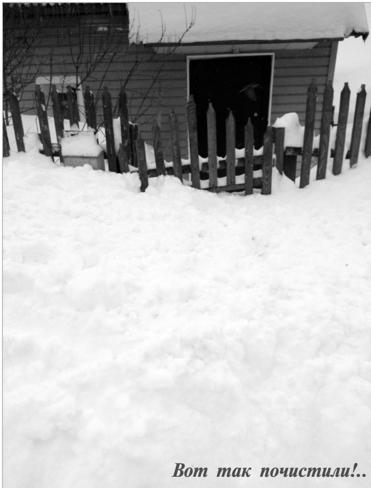
Вот так почистили!..

Хотелось бы надеяться, что это произойдет в самое ближайшее