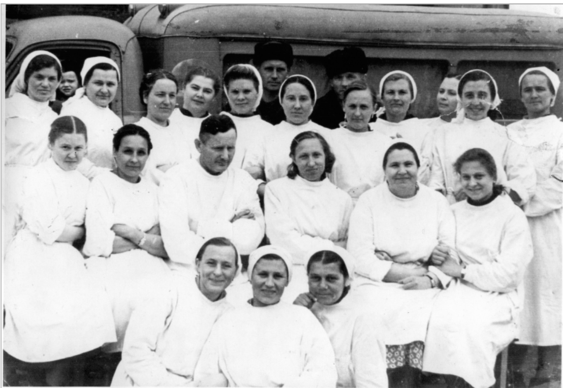
Коллектив Боровлянской участковой больницы. 1953 год.