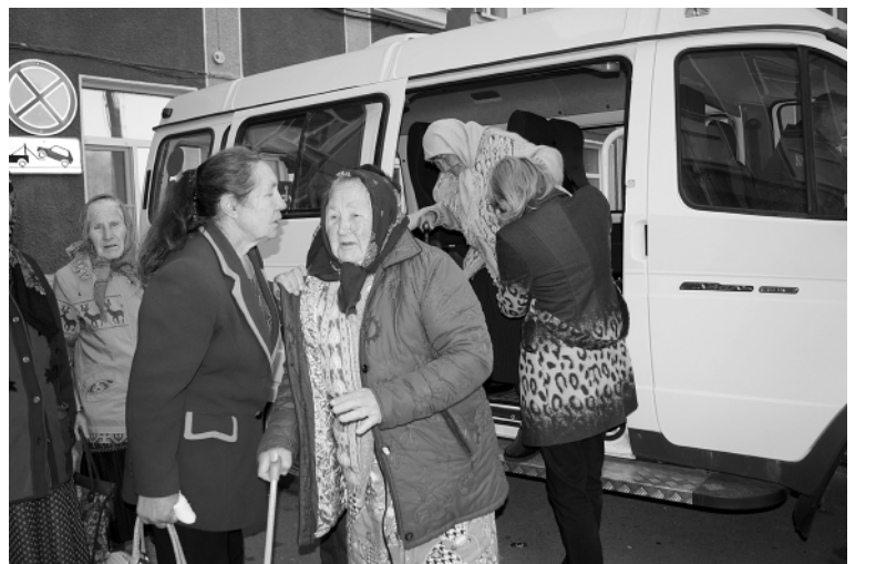
С октября 2019 года Комплексный центр начал оказывать услуги по доставке лиц старше 65 лет, проживающих в сельской местности, в медицинские организации для оказания медицинской помощи и проведения профилактических медицинских осмотров.