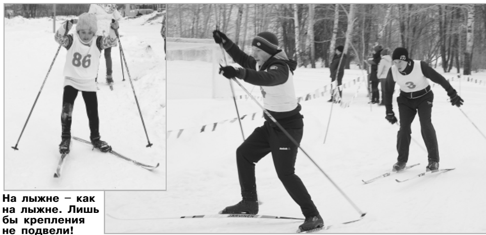
На лыжне — как на лыжне. Лишь бы крепления не подвели!

традиции и учат этому молодое поколение.