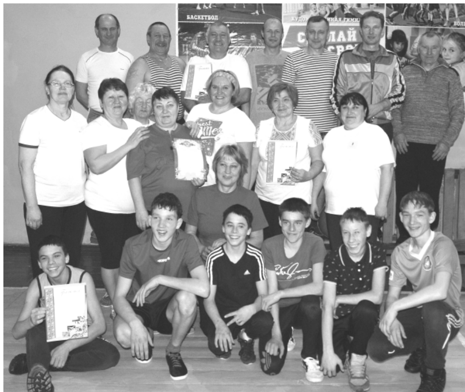
На этот раз в большую спортивную компанию пенсионеров и ветеранов влились ребята из Центра помощи детям, оставшимся без попечения родителей.

Ребята сначала были как будто не уверены в своих силах, но потом поймали задор