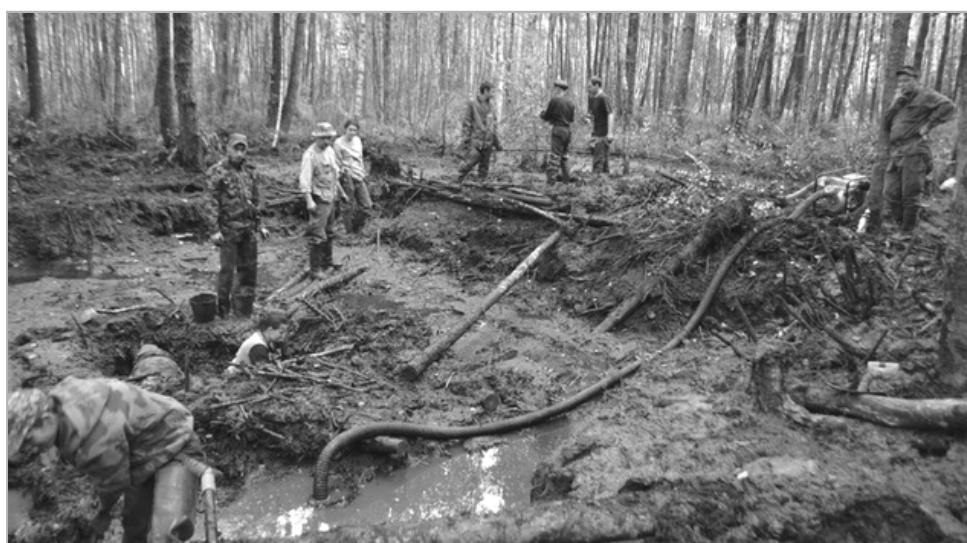
Та самая воронка, из которой подняли останки семерых бойцов.

Стоит лишний раз говорить о том, что участники поисковых отрядов делают очень большое и нужное дело, вписывая в вечность имена все новых и новых героев? Наверное, все-таки стоит, хотя бы для того, чтобы представить, насколько трудна работа поисковиков. Один из эпизодов, который они вспоминают, – это работа в огромной воронке, достигающей в диаметре 15, а в глубину – двух метров и заполненной до краев водой. После откачки вода прибывала вновь, поэтому приходилось работать очень