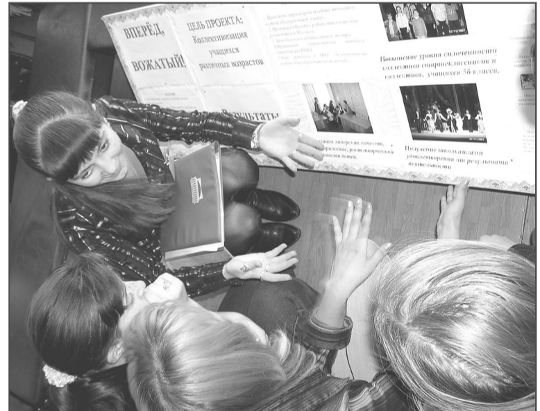
Сколько новых идей появляется в процессе обсуждения! Всех лидеров ждет интересная, полная побед и удач жизнь, ведь они уже сегодня активно строят свое «завтра».