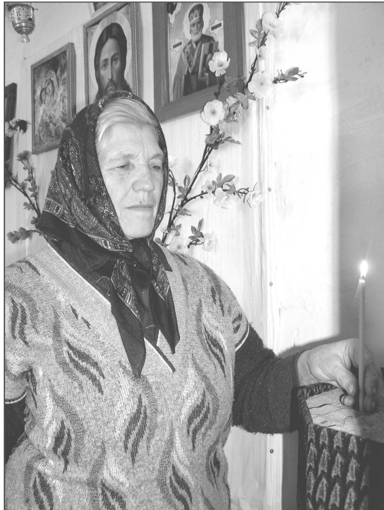
Молеальный дом Казанской иконы Божией Матери в поселке Гордеевском: слава Богу, теперь есть куда прийти помолиться, поставить свечку...

Открытие молеального дома в Гордеевском можно считать не