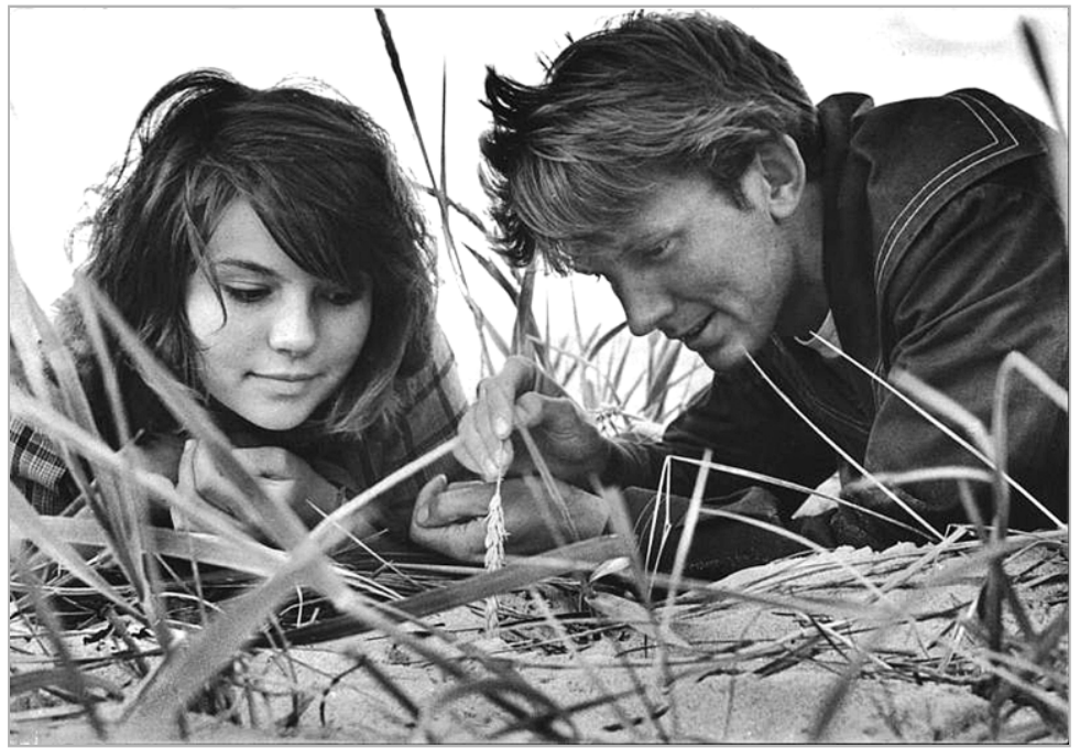
Фото из серии «Романтика советской эпохи» (из открытых источников).

Рассказав обо всем домашним, Тима отправился в сельсовет и выяснил, что везде-