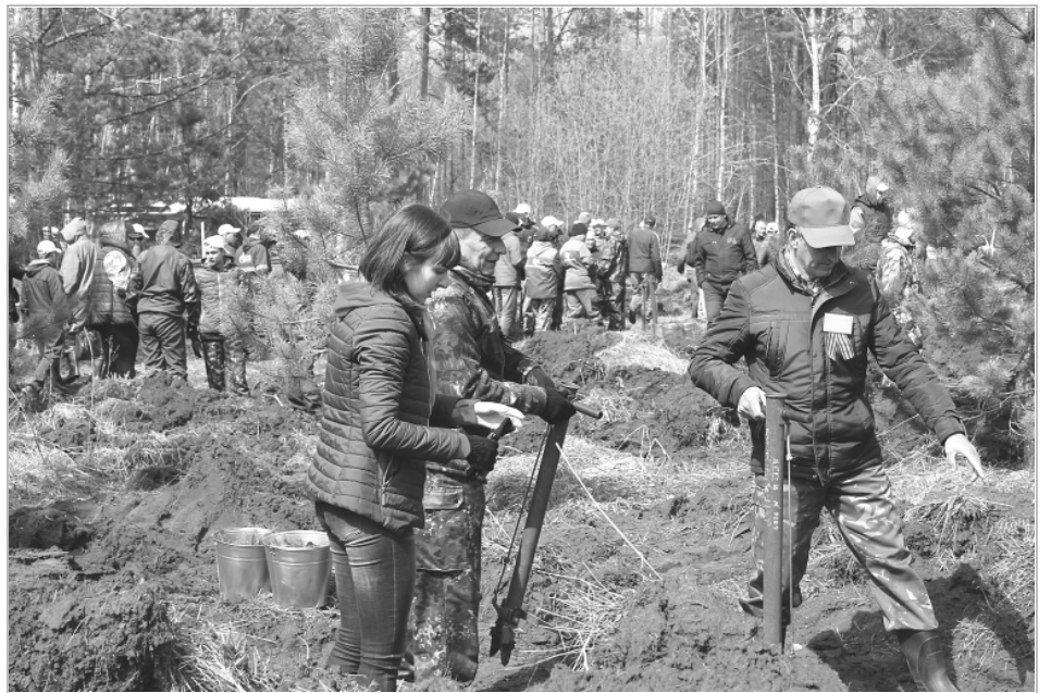
Для участия в акции неравнодушные люди приехали из разных уголков края. Если у кого-то не хватало опыта в посадке леса, им на помощь приходили работники Боровлянского лесничества.

В среднем за год в рамках акции алтайский Лес Победы увеличивается на 300 гектаров, что составляет почти 10% от общего объема лесовосстановительных мероприятий, проводимых Минприроды Алтайского края.