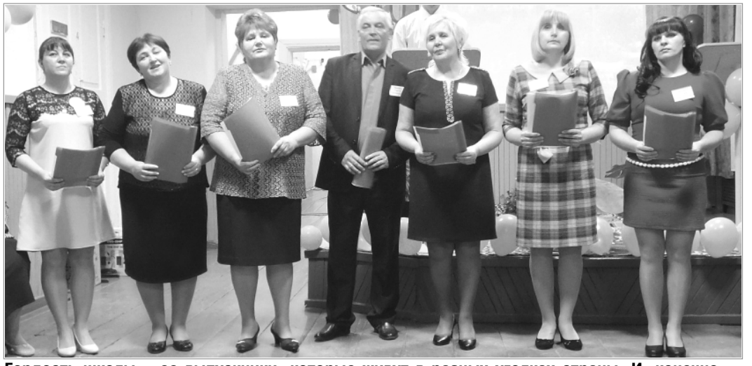
Гордость школы – ее выпускники, которые живут в разных уголках страны. И, конечно же, те, кто теперь работает в родных стенах.