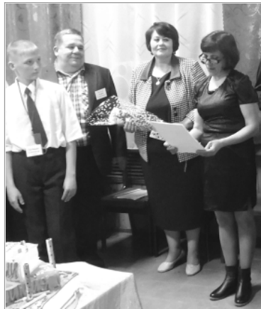
Как и принято в юбилей, было произнесено много душевных и приятных слов в честь виновницы торжества.

Затем все с особым чувством посмотрели фильм «Выпускники нашей школы».