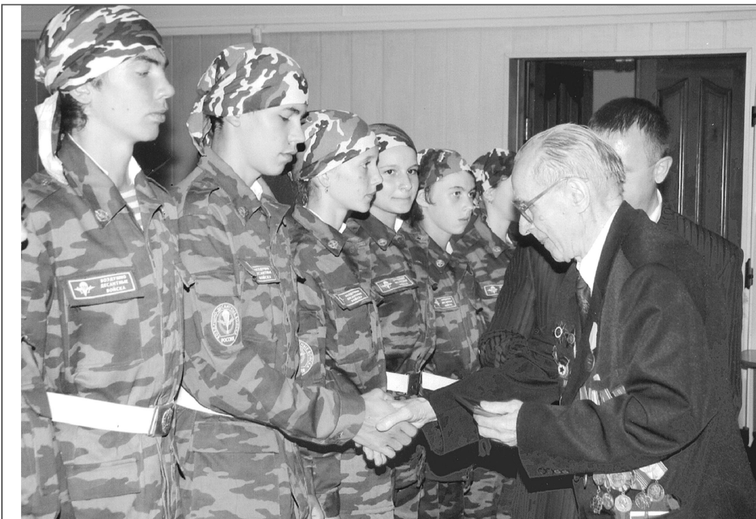
Молодое поколение свято чтит традиции воинской славы отцов и дедов. В военные клубы, объединения принимают самых достойных. Ребята с гордостью носят военную форму, пополняют военные училища и готовятся к службе в армии. На снимке: герои-фронтовики поздравляют новых членов патриотического клуба.

132 ветерана Великой Отечественной войны.