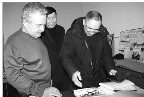
Гости праздника с неподдельным интересом рассматривали выставку фотографий прошлых лет.