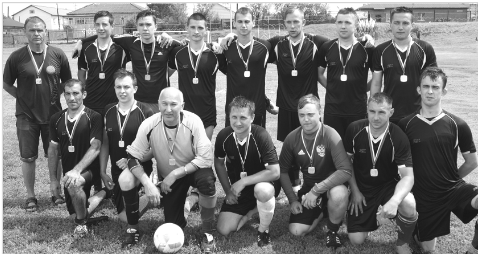
Победитель в футболе – команда ДЮСШ.

подготовки, и считаю, что организаторы нынешней олимпиады – молодцы. Думаю, наша команда и в этом году, как и последние пять лет подряд, займет первое место. А зрителей... Как у нас их было мало, так и здесь не видно.