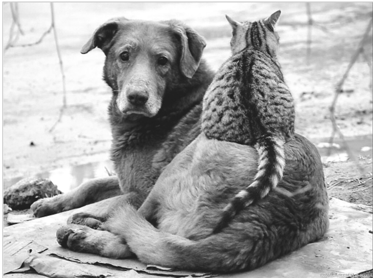
Когда для братьев наших меньших мы становимся источником зла, даже такие, казалось бы, непримиримые враги, как кошка и собака, ищут поддержку друг в друге.

Кроме того, вновь выявились вопиющие факты жестокого обращения с животными. Так, в подвале дома №20 на ул. Комсомольской обнаружены изуродованные трупы двух кошек. Не так давно защитники животных добились возбуждения уголовного дела за издевательства над кошками в пос. Южном (г. Барнаул), но это, к со-