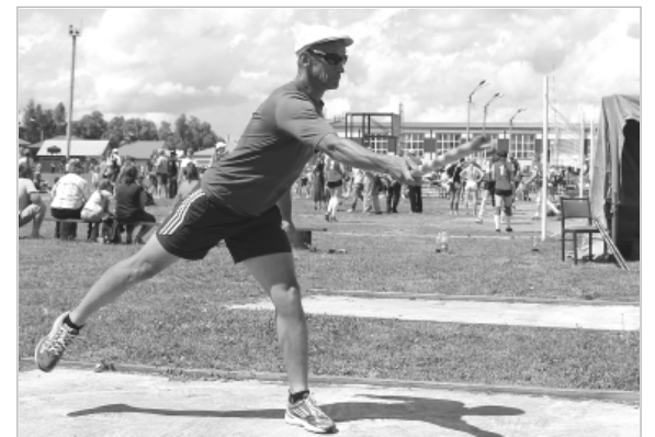
Если на волейбольных и баскетбольных площадках играла молодежь, то городошников в основном представляли спортсмены старшего поколения.