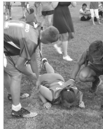
Жаркий день горячих баталий...

бицкий вместе с тренерским составом школы, оперативно решали вопросы председатель