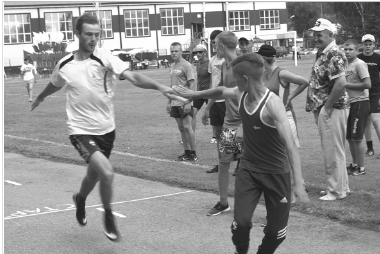
Групповые эстафеты 4x100 и 4x400 метров притягивали внимание болельщиков.