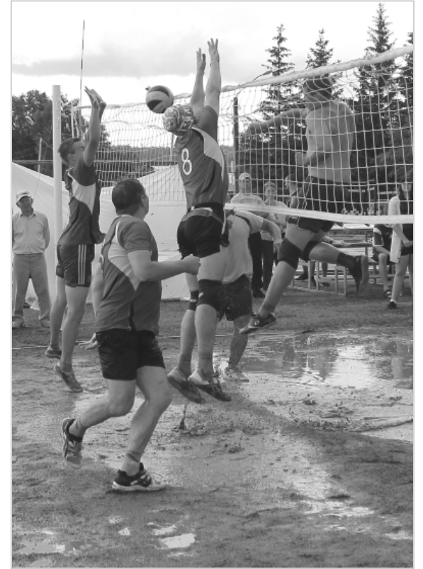
Матч состоится в любую погоду – дождь не помеха настоящим спортсменам, а ливень не может остудить спортивный азарт!