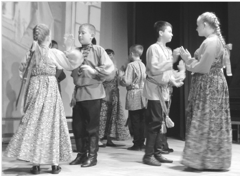
Участники детского фольклорного ансамбля «Веретейка» Троицкой ДШИ на сцене уже давно не новички. Ведь большинство из них — выпускники детского сада №1 «Родничок», работающего по программе возрождения русской культуры.