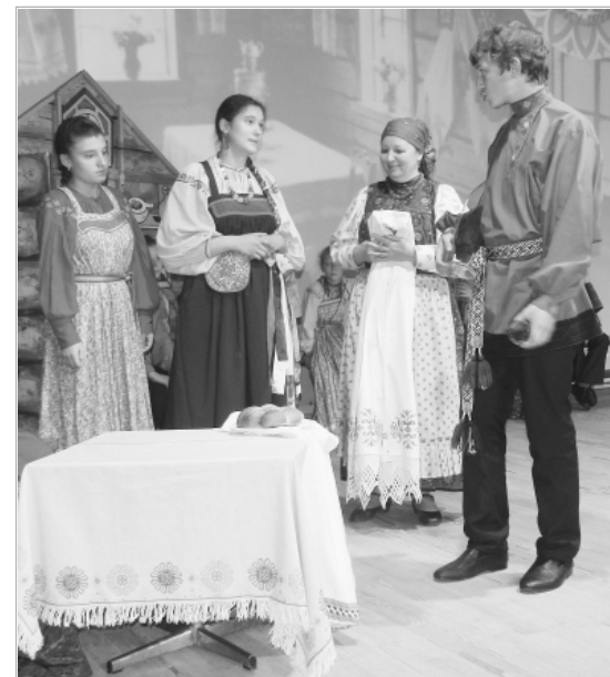
Участники фольклорного ансамбля «Стрела» Алтайского краевого колледжа культуры и искусства представили на троицкой сцене один из эпизодов «поляцкой» свадьбы.

Известно, что праздник Покрова на Руси совпадал со временем