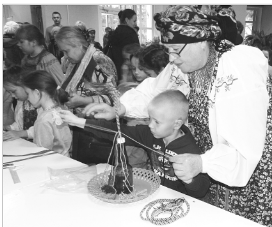
Непростому искусству плетения опоясков в Древней Руси обучали с малых лет. Мастер-класс по народным ремеслам на вечерках в ДШИ проводили педагоги Троицкого детского сада «Родничок».

В начале концертной программы зрителям был представлен фильм «Хранители традиции земли троицкой», рассказывающий о развитии фольклорного движения в районе в рамках программы возрождения русской культуры, которая начала внедряться в жизнь 25 лет