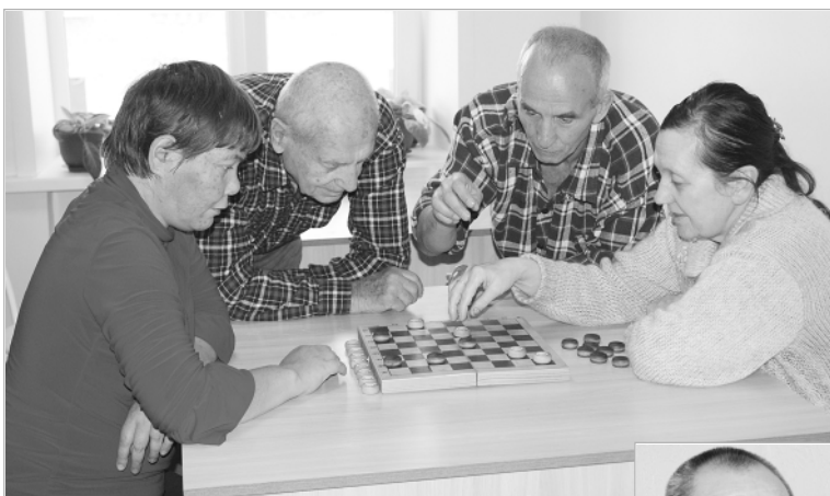
Шахи – интересная игра. Совет друга не мешает!

Всем коллективу интерната желаю здоровья, успехов и взаимопонимания. Особые слова благодарности – ветеранам учреждения. Ведь именно они заложили крепкий, надежный фундамент и пере-