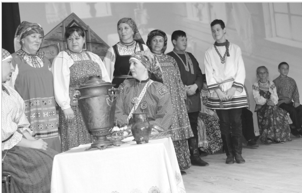
Покров на Руси — время свадеб. Теме традиционного сватовства было посвящено выступление народного фольклорного ансамбля «Большеречье» Троицкого межпоселенческого Дома культуры.

назад. При работе над фильмом автор Игорь Шлыков использовал архивные видеозаписи, рассказывающие о первых шагах работников Троицкого народного дома, которыми в свое время не только были собраны уникальные материалы, но и заложена прекрасная традиция изучения народной культуры.