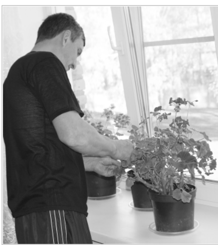
Если летом территория психоневрологического интерната утопает в цветах, то зимой – море цветов внутри. За ними ухаживают сами проживающие.