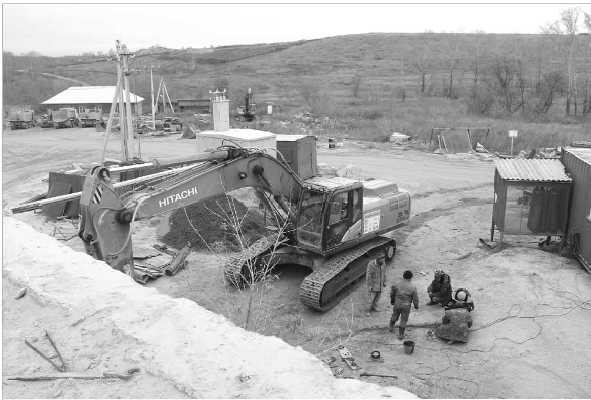
Увидеть масштаб и мощь производства можно только с высоты.

Технологический процесс сложный: вначале проводятся вскрышные работы, мы работаем открытым способом – убирается слой грунта, глины и вывозится на отвал. Зачищается блок, затем маршейеры разбивают его и выдают карту. Далее специализированная компания проводит бурение скважин нужного диаметра и глубины, после чего уже другая, взрывная компания, закладывает взрывчатку, и осуществляется подрыв. Затем горную массу в карьере грузим экскаваторами в самосвалы, отвозим на фабрику и загружаем в питатель, откуда камень размером до полуметра попадает в специальные дробильно-сортировочные установки и после – в грохоты. Отбиваются различные фракции, они по-