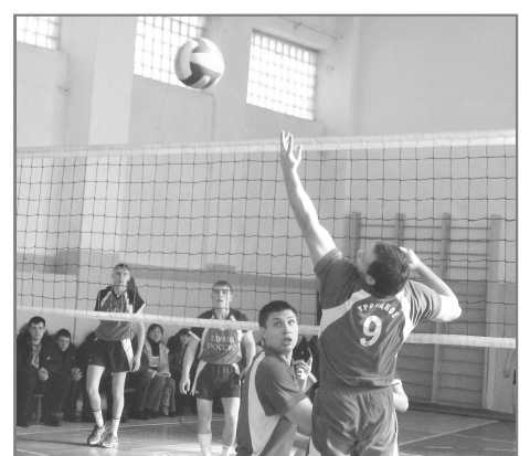
Финальная игра тройчан с «Динамо-Плюс» (БЮИ) была напряженной.