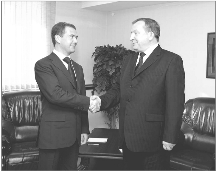
Рабочая встреча Александра Карлина и Дмитрия Медведева.

Дмитрий Медведев поддержал инициативу Александра Карлина о наделении аграрных регионов особым статусом.