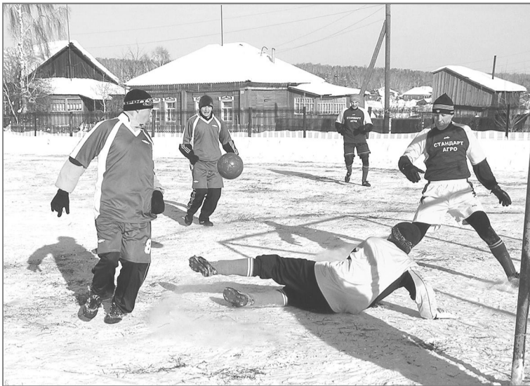
На воротах стоять не приходилось – мячи брались лежа...

Победителем стал наш «Факел». Второе и третье места заняли барнаульские волейболисты.