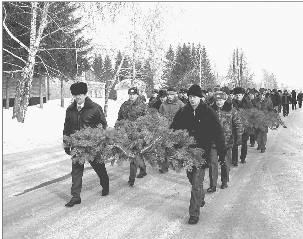
Участники локальных войн и конфликтов торжественно прошли по главной улице райцентра.

15 февраля в нашем районе, как и по всей стране, отмечали 19-ю годовщину вывода советских войск из Афганистана. Мероприятия, приуроченные к этой дате, проходили в течение трех дней. А начались они с общего собрания участников локальных войн и конфликтов в администрации района.