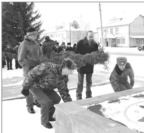
К мемориалам павших в годы Великой Отечественной войны и погибших в горячих точках были возложены гирлянды и цветы.

СЫНОВЬЯ И ВНУКИ тех, кто участвовал в Великой Отечественной войне, и сами кровью полившие землю Афганистана, Чечни, Таджикистана, Нагорного Карабаха, Сербии, воевавшие на Африканском континенте и в Юго-Восточной Азии, возложили гирлянду к мемориалу погибших в годы Второй мировой войны.