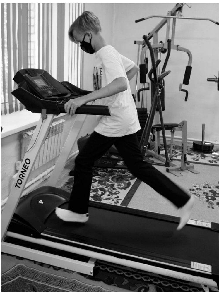
В краевом центре «Родник» проходят индивидуальные занятия на новом оборудовании.

С 2020 года в рамках госпрограммы действует подпрограмма «Формирование системы комплексной реабилитации и абилитации инвалидов, в Алтайском крае». Напомним, что реабилитация — это восстановление после операции, лечения или болезни, целью которого является полное или частичное возвращение утраченных функций. Абилитация — это программа по предуп-