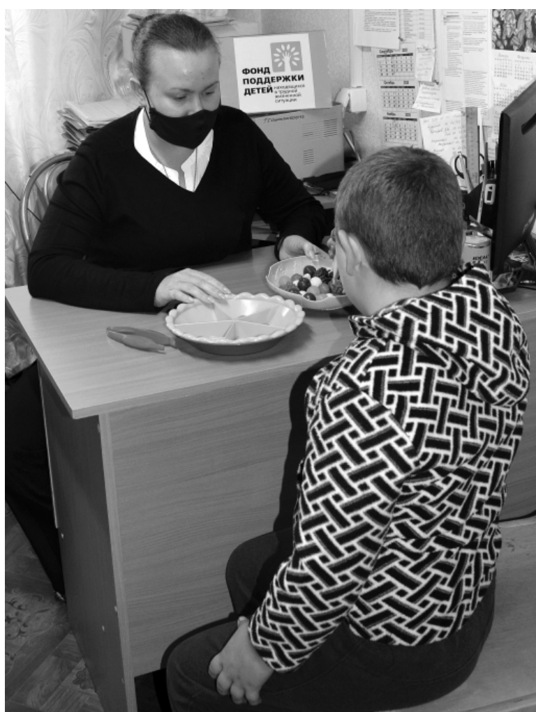
Выездная работа специалистов проекта «Твой мир возможностей».

Подготовлено управлением печати и массовых коммуникаций Алтайского края совместно с Минсоцзащиты Алтайского края.