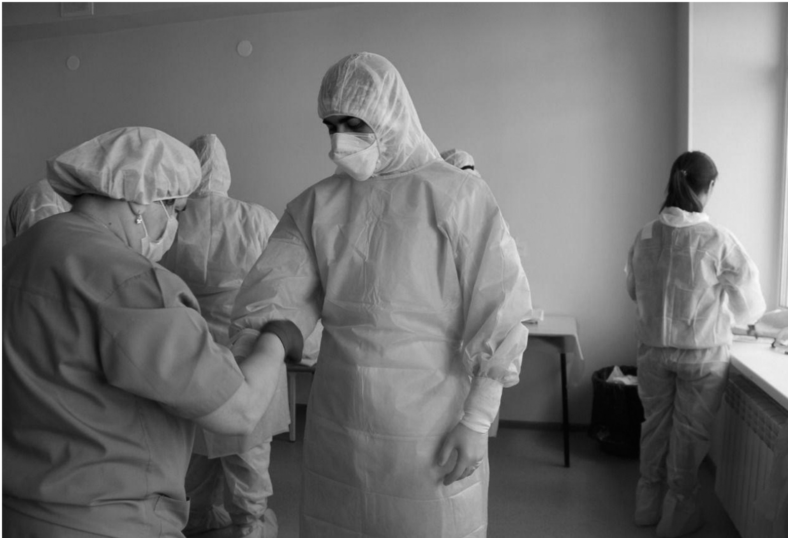
Врач готовится зайти на работу в красную зону.

Не только на Алтае – во всех регионах России борьба с коронавирусной инфекцией идет нелегко. Сказывается не только дефицит врачей, препаратов, но и массовая тревога – она мешает людям успокоиться и подумать, что каждый из нас с помощью ресурсов, имеющихся в регионе, и собственных может сделать для сбережения себя, любимых, и близких своих. Как не заболеть до того момента – он уже не за горами! – когда начнется массовая вакцинация населения.