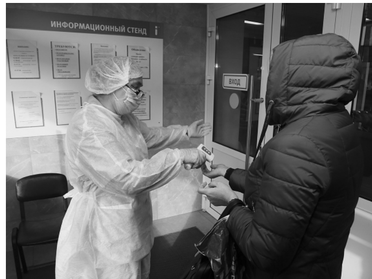
Термометрия на входе в поликлинику.