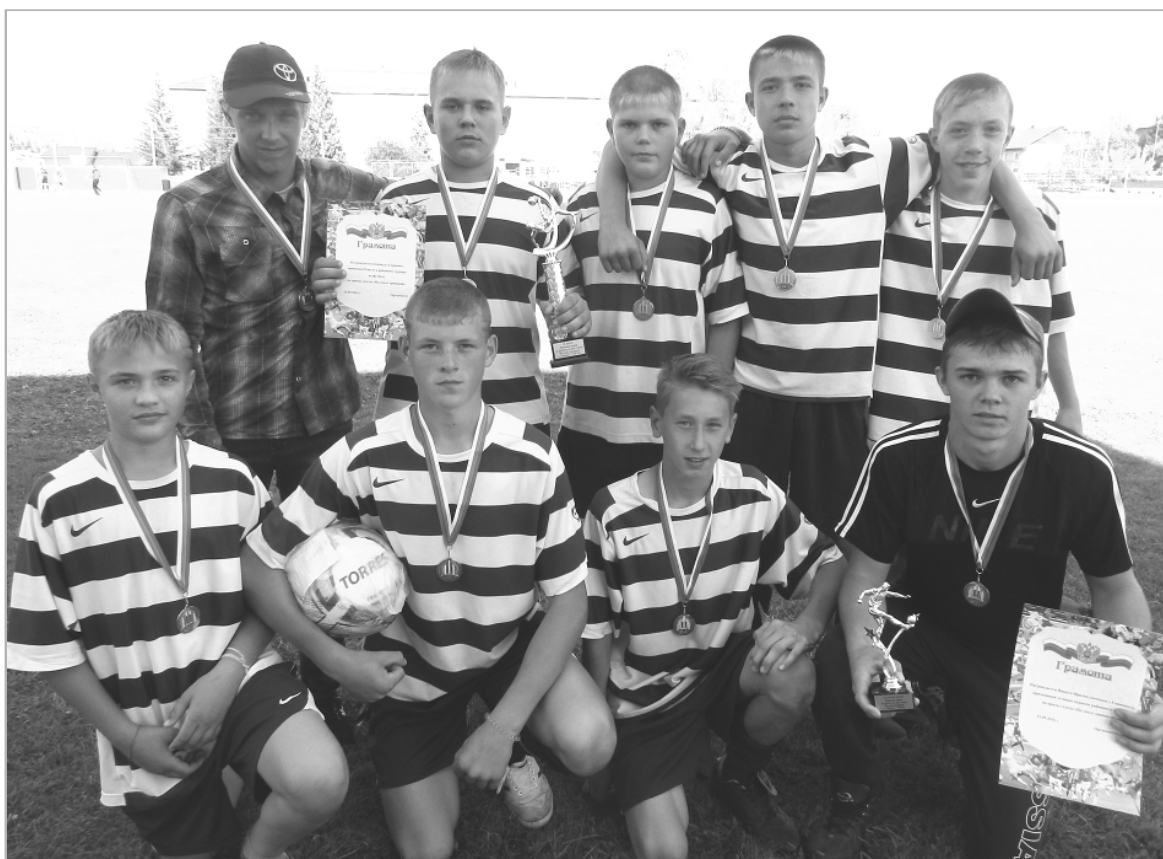
Среди победителей в старшей подгруппе — горновские футболисты.

Когда наблюдаешь за мальчишками, которые гоняют по полю мяч, тем более если они рвутся к победе, стремясь обыграть соперников, испытываешь громадное удовлетворение от того, что наши дети не перестали увлекаться физкультурой и спортом. Каждый, кто помогает их развитию, кто считает своим долгом прививать мальчишкам и девчонкам любовь к физкультуре, здоровому образу жизни, занимается поистине благородным делом. Объективно говоря, пример взрослых, которые сами увлекаются спортом, для детей и подростков всегда убедительнее, чем воспитательные беседы. Приятно сознавать, что в районе есть добрые люди, мы их привыкли называть спонсорами, которые финансиру-