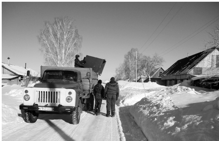
В течение недели в райцентре велась работа по установке контейнеров в местах накопления ТКО.

Обращаю внимание жителей села Троицкого на необходимость