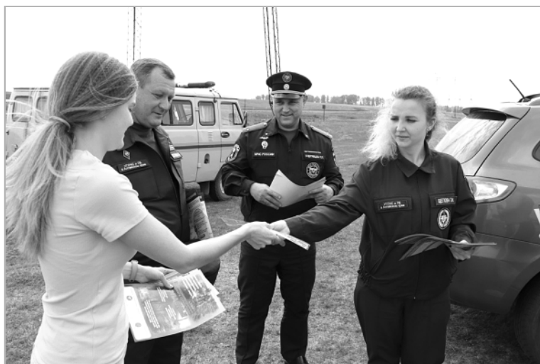
Выполнение правил поведения на воде и дисциплина пребывания в местах отдыха – залог безопасности каждого человека! Сотрудники управления ГОЧС и ПБ в Алтайском крае ведут профилактическую работу в местах отдыха.

Лучшее время для купания – утренние и вечерние часы. Днем купаться не рекомендуется, потому что возможно перегревание, и, находясь долго в воде, можно простудиться. Для комфортного купа-