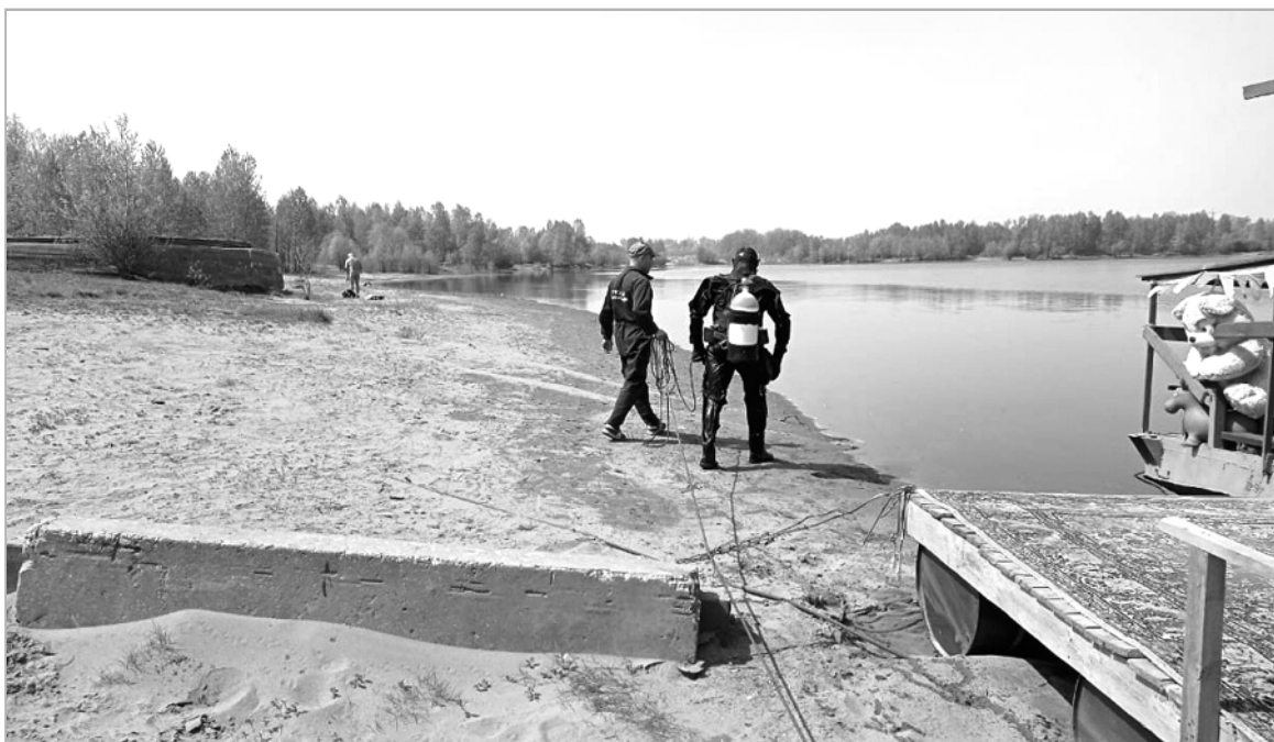
В преддверии купального сезона специалисты обследуют берега и дно предназначенных для купания водоемов.

В-четвертых, на пляжах устанавливаются знаки безопасности и информационные стенды, на которых есть информация о режиме работы пляжа, зонах купания с указанием мест расположения спасателей, прогнозе погоды на текущую дату, температуре воды и воздуха, о приемах оказания первой помощи людям и т.д.