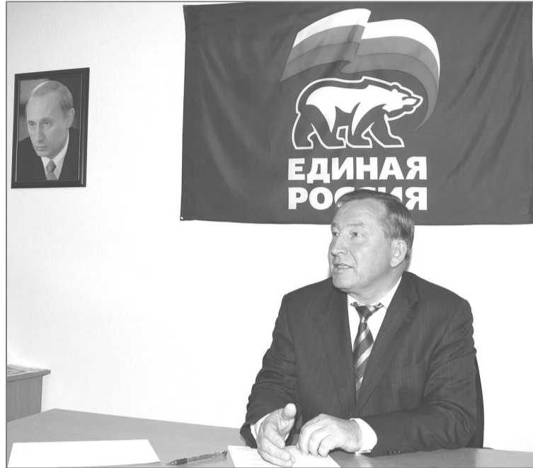
Губернатор А.В. Карлин ведет первый прием.