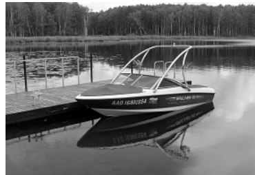
К услугам гостей — всегда наготове катер. Можно прокатиться по озеру или отправиться на рыбалку.

— Прибыльность предприятия невелика, вырученных средств хватает на содержание базы и заработную плату, — продолжает А.Э. Аветян. — Но и убытков нет, хотя наши