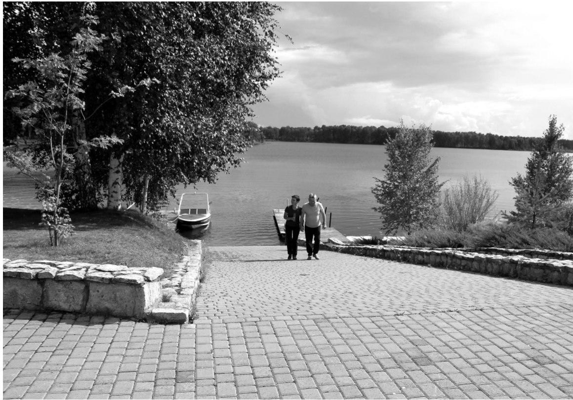
Выложенная плиткой дорожка спускается к воде, а на берегу взору открывается живописная панорама.

Чтобы избежать проблем, связанных с отключением электроэнергии, установили собственный дизель-электрогенератор и устроили