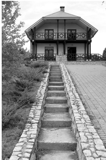
Главный корпус — красивое здание, а в нем есть все — уютные номера, телевизор, кухня, бильярд и даже камин.