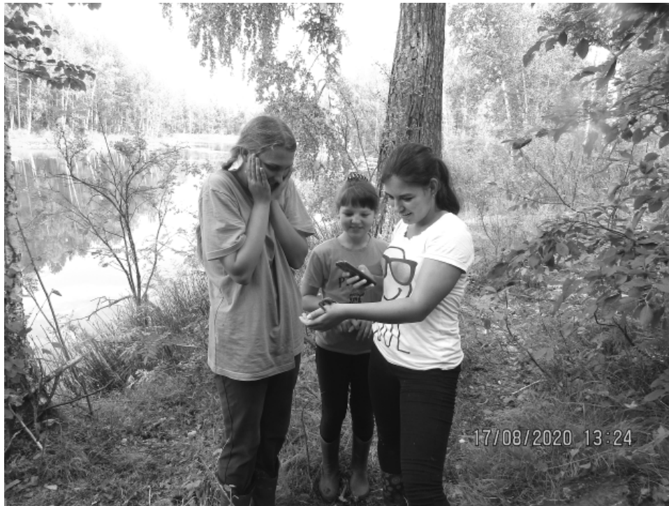
Девочки нашли летучую мышь.

В ходе исследовательской экспедиции мы обратили внимание на одно необычное, погруженное в воду растение. Его листья по краям покрыты очень мелкими многочисленными зубцами. Мы его еще определяем, связываемся со специалистами, но, по предварительным данным, похоже, это каулиния гибкая. В следующий раз обязательно сделаем дополнительные фотографии, которые помогут ботаникам верифицировать нашу