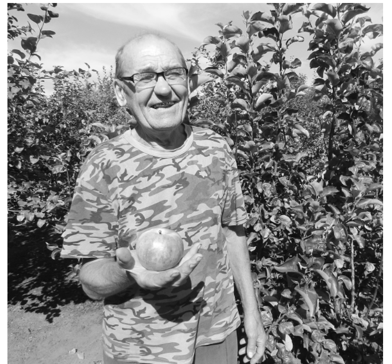
Они построили дом, вырастили сад... Именно благодаря им село Уткино еще не исчезло с карты нашего района.

— Были... Даже из приюта привозили... Всех порвали собаки из-за реки. Я каждую оплакивала, как человека. Одна, Паля, такая краса-