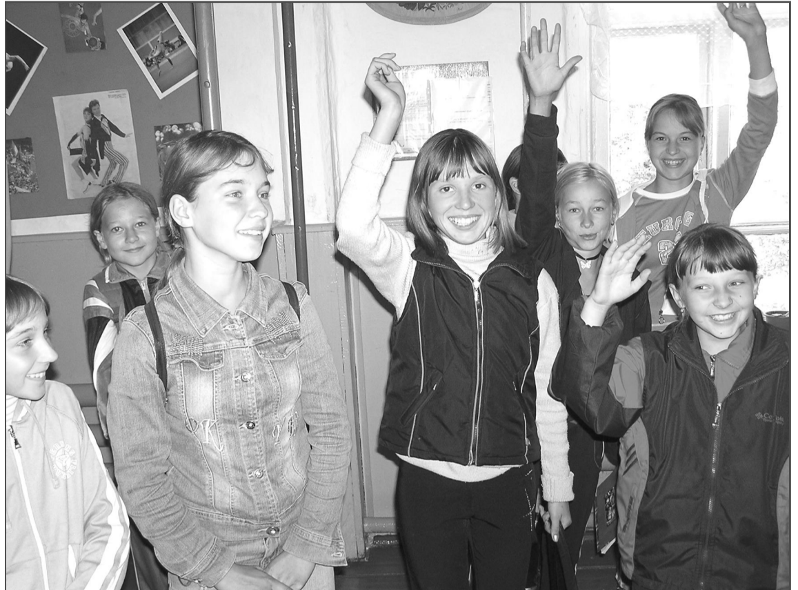
«Шаг налево, шаг направо, два – назад и три – вперед!» – энергично отбивают ритм тюменские девчонки и мальчишки. Начались занятия, а значит, и долгожданные репетиции в танцевальном кружке.