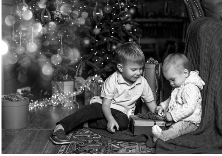
Детей без подарка оставить нельзя!