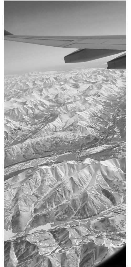
Под крылом самолета — завораживающая картина!..

И вот мы почти на месте. Оставили уставшую машину на берегу ручья, через который решили не ехать, опасаясь крутого спуска, и пошли пешком. Через двести метров — волшебное место. Из-под земли бьет парящий источник, пахнет серой. Горячая вода стекает по камням и собирается в рукотворных купелях. Кто-то постарался и облагородил это место. Даже градусник для воды плавает. В первой «луже», размером примерно пять на шесть метров, температура воды — 38 градусов. Чуть подалеже — второй рукотворный «бассейн» такого же размера. Тут вода немного прохладнее — успевает остыть по пути. Температура воздуха — примерно плюс шесть. Мы быстро переодеваемся, побросав свои лыжные комбинезоны и промокшие зимние ботинки. Носки раскладываем сушиться на теплых камнях. Я осторожно пробую ногой воду, как тот Фома, не веря, что вообще такое может быть в природе. В «луже» уже млеют несколько туристов. Осторожно захожу в воду и восклицаю: «Она и вправду горячая!». То растягиваюсь во весь рост, то сажусь, погружаясь в воду по самую шею. Мужчины разжигают мангал. На углях шкворчит мясо, разнося упоительный запах. На склонах сопки лежит снег, а вокруг «луж» цветут одуванчики. Выползаю из горячей воды, как из парилки! Шашлык,