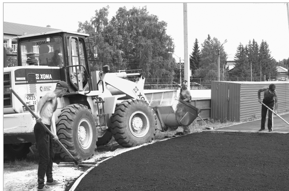
Работы на стадионе ведет ООО «Сибирская строительная компания». На этой неделе закончилась укладка асфальта на беговой дорожке.

среды», в рамках которой предусмотрено софинансирование из федерального, краевого и местного бюджетов. Общая сумма в этом году составляет около 4 млн. рублей.