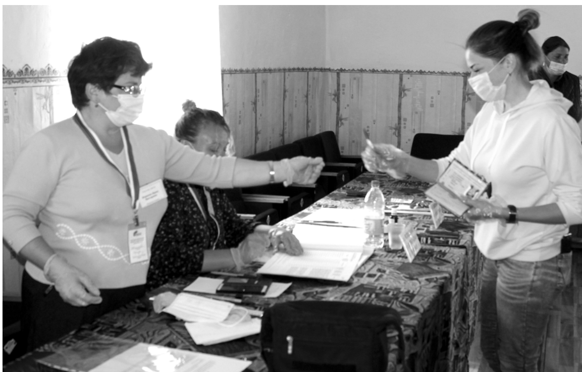
На избирательном участке в Зеленой Поляне.

«По списку у нас зарегистрировано 127 избирателей, но проблема в том, что много «мертвых душ», всего у нас проживает около 70 из-