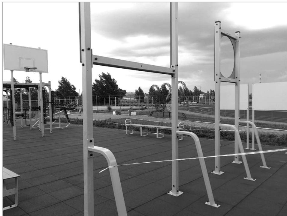
Современные спортплощадки появятся во всех сельских районах Алтайского края.

Из-за того, что поставка комплектов спортивного оборудования состоялось в конце 2019 года, установить малые спортплощадки до снега успели только в Ребрихе и