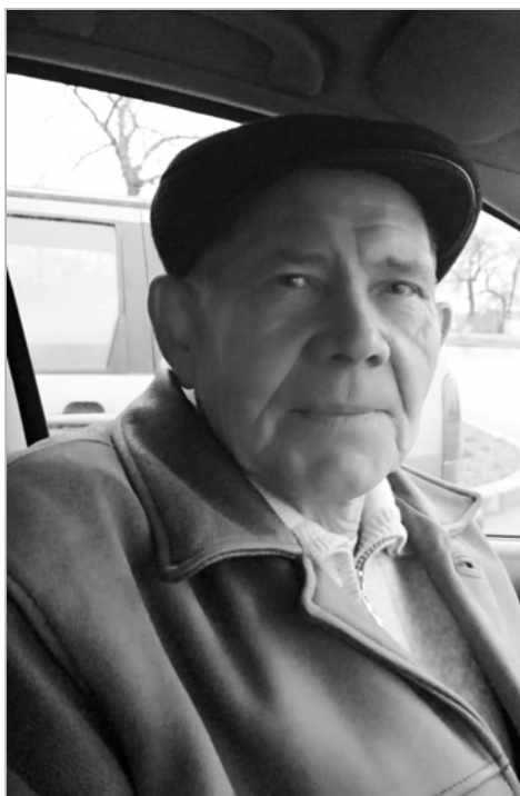
...и в наши дни.

рой несла потери и советская сторона. Всего в Эфиопии погибло и умерло 79 советских военных, ранено девять, пропало без вести пятеро, пленено трое. Многие переболели экзотическими африканскими болезнями.