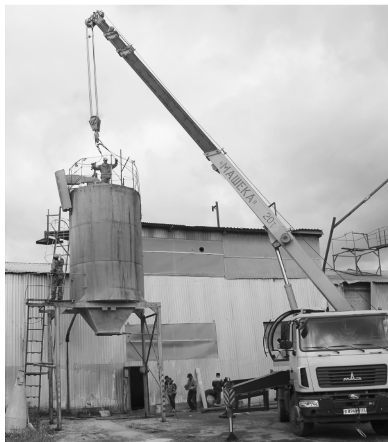
На территории ООО «АЛСИ», входящего в сегмент перерабатывающей промышленности района, полным ходом идут строительные работы, которые ведет подрядная организация из Барнаула.

В настоящее время на заводе идет реконструкция, старое оборудование демонтировано, устанавливается новое. Завершить переоборудование планируется к нача-