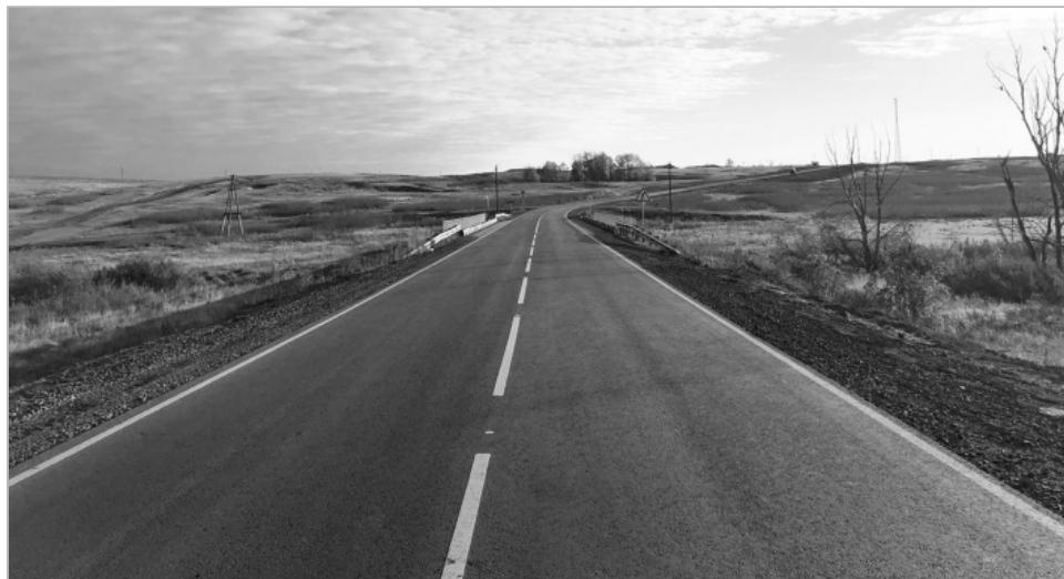
Автодорога «Павловск – Камень-на-Оби – граница Новосибирской области».

монтировано более 830 км автодорог Алтайского края. Работы будут включать в себя мероприятия по содержанию трасс в нормативном состоянии, а также строительству и реконструкции сельских дорог и мостов.