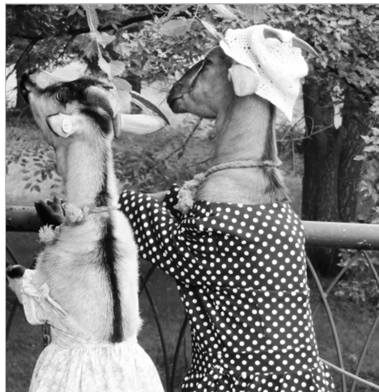
Фоторабота Людмилы Сенченко (с. Зеленая Поляна).