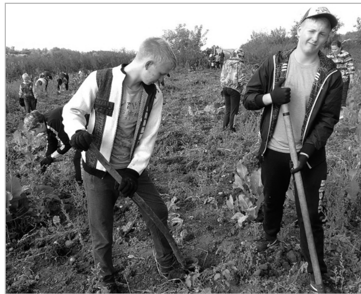
Ельцовские школьники копают картошку.

Е. БОРОЗДИНА, М. РАЧИЛИНА, методисты ДЮЦ.