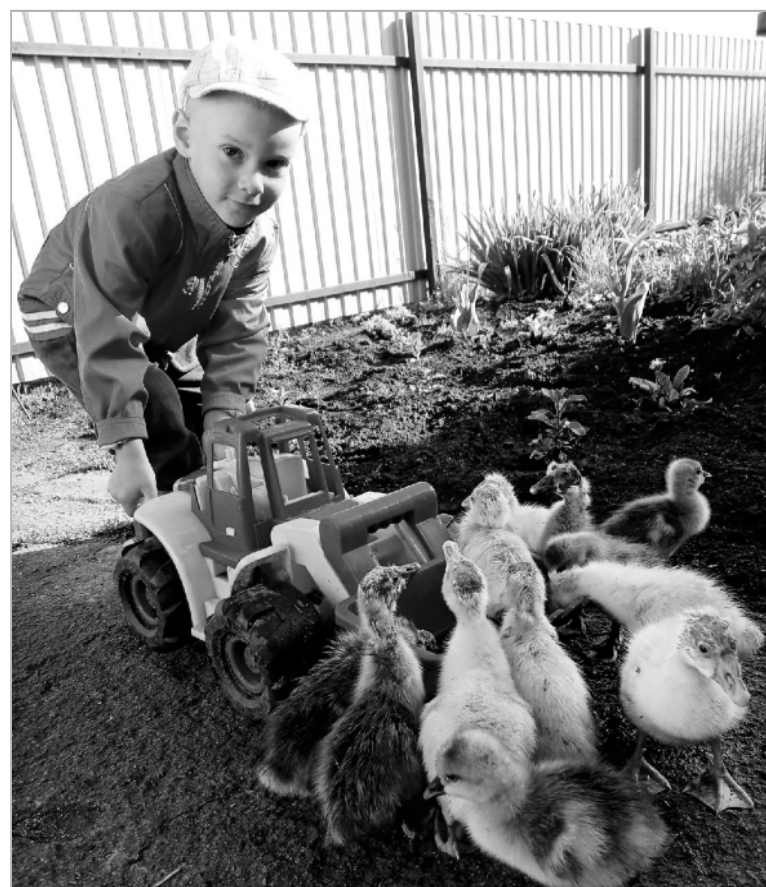
Этот сюжет запечатлела Ульяна Солиженко (с. Горное).