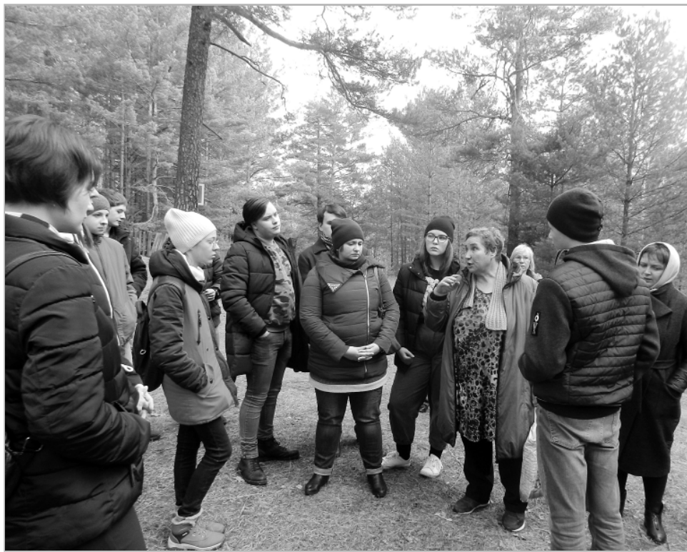
По пути к мемориалу «Жертвам репрессий» ребята продолжили знакомство с трагической историей репрессированных и спецпереселенцев Песьянского отделения Сиблага.