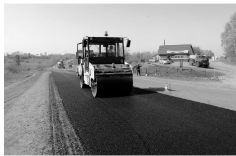
Ремонт автодороги «Бийск — Мартыново — Ельцовка — граница Кемеровской области».

Трасса «Поспелиха — Курья — Третьяково — граница Республики Казахстан» также служит транзитным маршрутом, но уже в рамках сообщения между двумя странами — Россией и Республикой Казахстан. Ремонт не менее важных дорог для жителей Алтайского края — «Крутиха — Панкрушиха — Хабары — Славгород — граница Республики