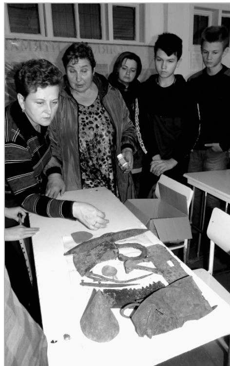
Во время экскурсии в село Заводское учащиеся троицких школ прикоснулись к страничке истории района, связанной с массовыми репрессиями в годы Великой Отечественной войны, и познакомились с артефактами, найденными в окрестностях села и являющимися вещественными доказательствами этих печальных событий.

«Я очень рада, что родилась на Алтае. Алтайский край богат не только своей историей, но и тем, что здесь живут люди с открытой душой, которые славятся своей добротой и гостеприимством и со щедростью делятся с другими. Земля Алтая хранит до сегодняшних дней останки тех, кто был репрессирован в те страшные 30-е годы. Очень многим из них, таким разным, но объединенным общей бедой, как могли, помогли выжить те, кто сам не был богат».