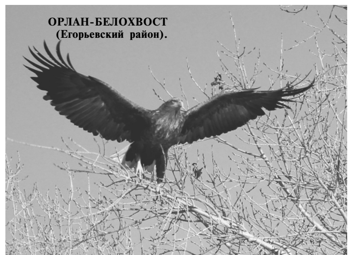
ОРЛАН-БЕЛОХВОСТ (Егорьевский район).

Важно максимально собрать известную информацию о редких видах. Возможно, что именно ваше сообщение станет новой точкой места обитания вида на карте Алтайского края. Сохранение редких видов, благодаря предоставленным сведениям, станет лучшей наградой для каждого из участников конкурса! Подробную информацию о конкурсе смотрите на сайте Ти-