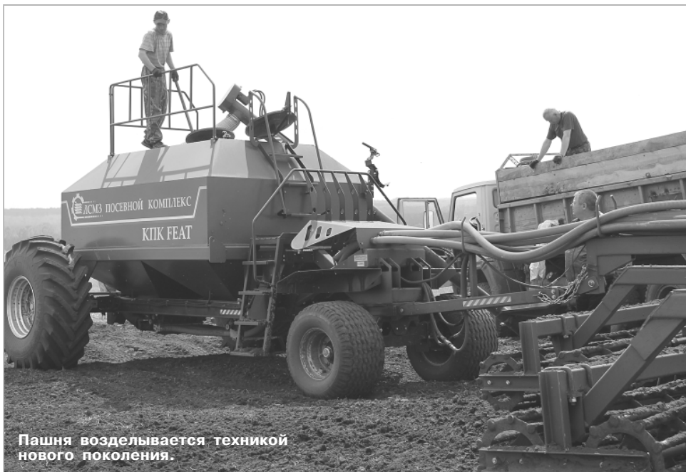
Пашня возделывается техникой нового поколения.