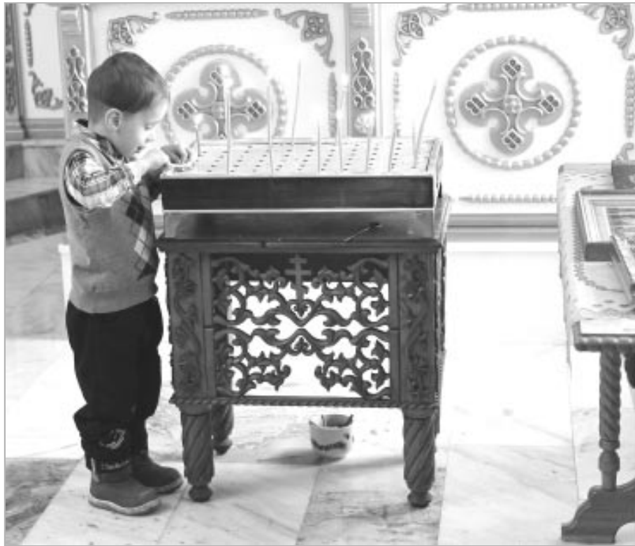
«...и кроткому Царю на лучезарном троне молитву детскую хор ангелов несет!» (В. Львов).

Свое место на звоннице храма заняли колокола, чин освящения которых 14 ноября совершили владыка Сергей, митрополит Барнаульский и Алтайский, и владыка Серапион, епископ Бийский и Белокурихинский. В верхнем храме установлено паникадило, еще одно займет свое место в алтаре. Оба паникадила были пожертвованы