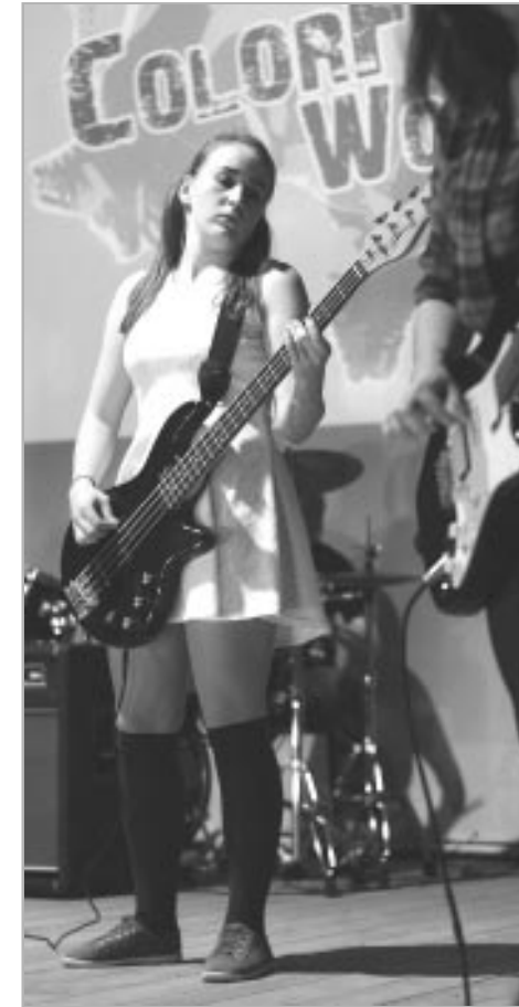
В «Табло» – только девушки.