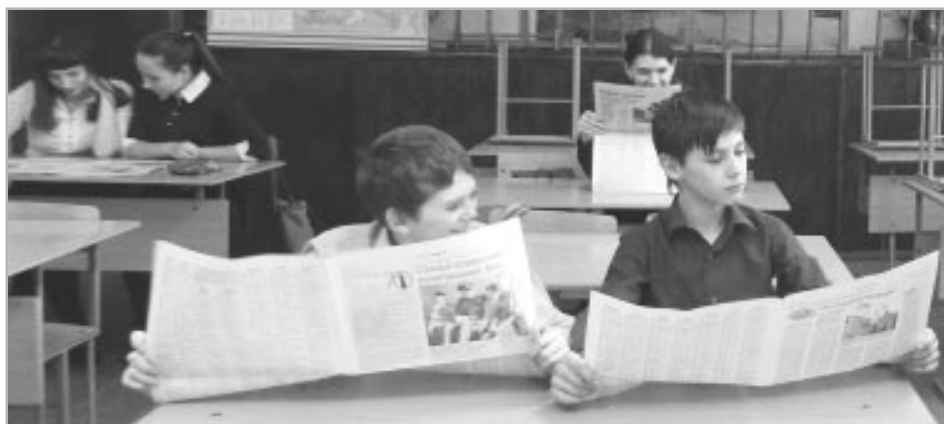
Во время встречи учащихся ТСШ №1 с корреспондентом газеты «На земле троичкой» ребятам было предложено выбрать наиболее интересные для них рубрики и сделать краткий обзор одной из газетных публикаций.