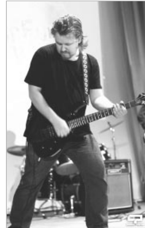
Участник группы «ЛИКБЕЗ».

Одно из мероприятий, которое проходило в прошлом году в троецком Доме культуры, стало межрайонным – молодежный фестиваль субкультур собрал и местных, и городских участников, веселую, радостную, воодушевленную толпу людей. В основном молодых, но не только.