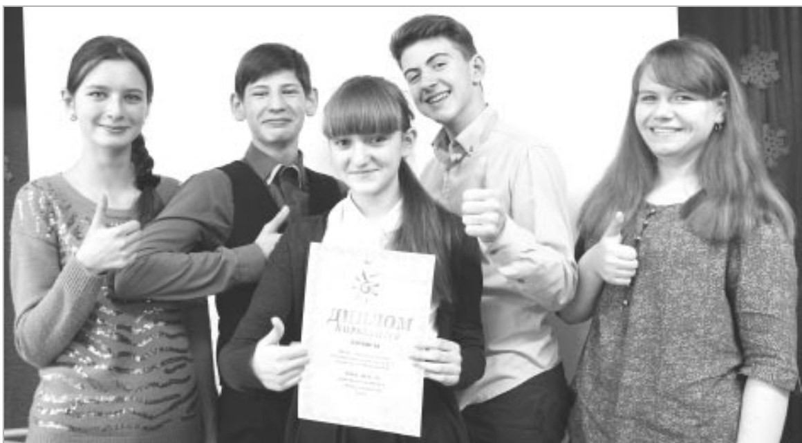
В номинации «Лучший вопрос» победителем стала команда ТСШ №1.

Самым сложным вопросом, на который ни одна из команд-полуфиналисток не дала правильного ответа, оказался вопрос о творческих псевдонимах известных писа-