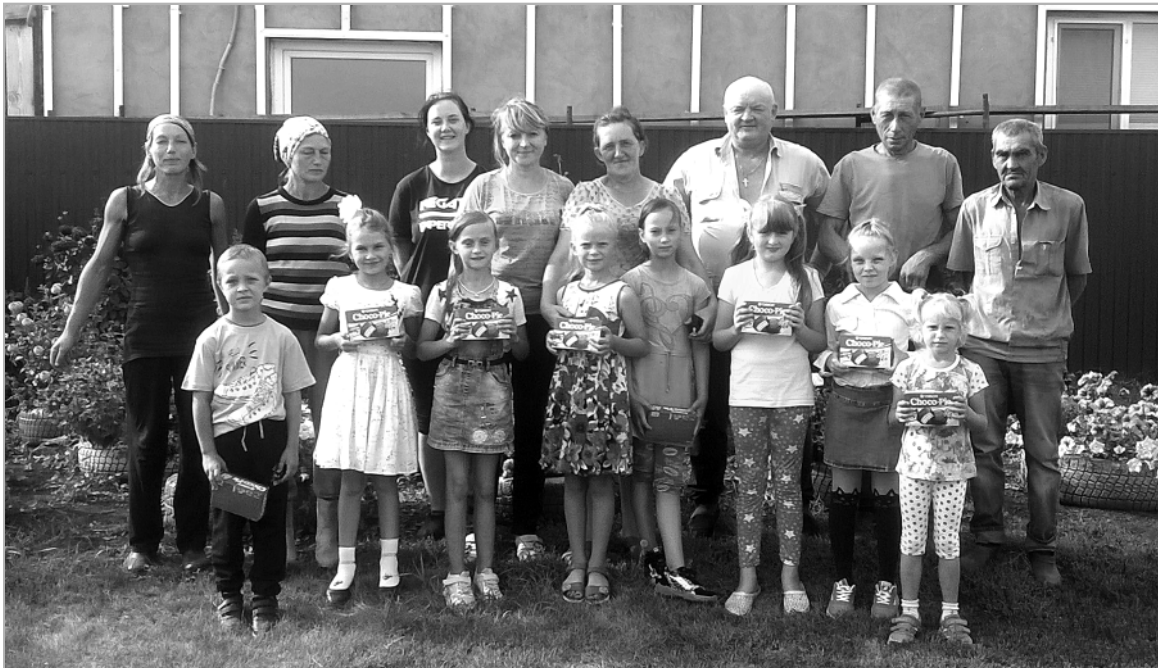
«Поющие капельки» в гостях у коллектива фермы КХ Ларисова .

Т. НЕФЕДОВА, зав. филиалом Большереченского дома досуга.