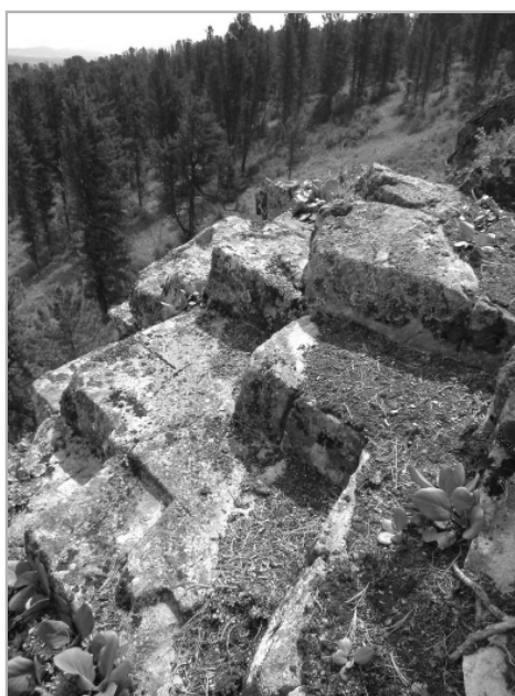
Лестница в небеса... Происхождение этих каменных ступеней до сих пор остается загадкой.