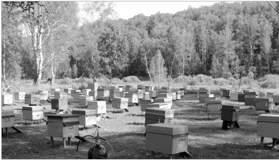
Пасека расположена в живописном месте.

Оплачено по договору с УСЗН по Троицкому району.