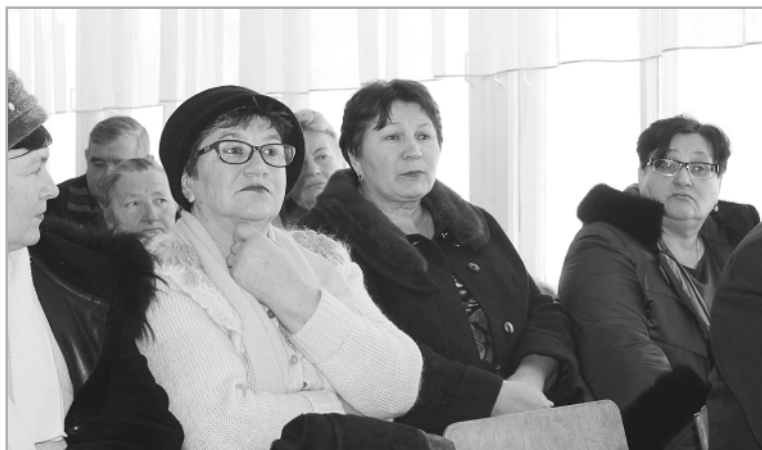
Пришедшие на встречу с главой района жители с. Белого с большим вниманием слушали ответы на свои вопросы.