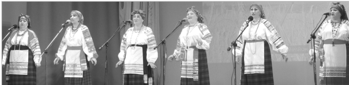
Черно-белое фото, к сожалению, не может передать всей красоты традиционных русских нарядов, в которых выходили на сцену солистки народного самодеятельного коллектива Алтайского края вокального ансамбля «Чемрочка».

А самый внимательный зритель еще и мог заметить, что перед его глазами промелькнули все четыре времени года, по которым русские люди сверяли свой народный календарь. Вот зазвенели птички трели, расцвели яркими красками леса и луга, а девушки надели венки из полевых цветов и закружились в танце, празднуя один из любимых в народе праздников — день Ивана Купалы. Они прыгают через костер, и у каждой в душе надежда — встретить своего суженого. Но только одной из них повезло — и счастливая пара уже в центре веселого хоровода... Незаметно пролетело лето, загрузила калина,