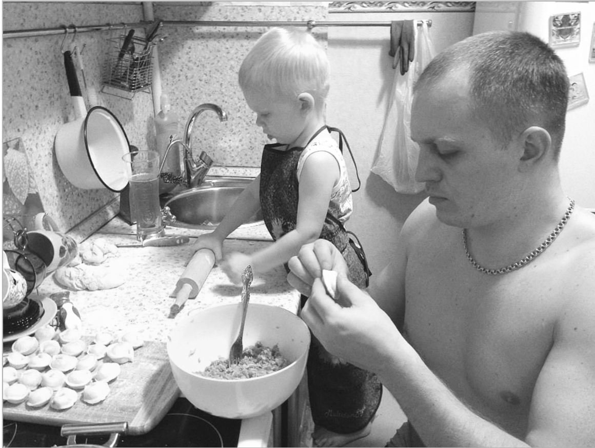
Мама придет, а у нас все готово. Спросит: кто такие молодцы?!

Китайский Новый год-2018 Желтой земляной Собаки начинается 16 февраля. Чем не повод?! Стряпать пельмени, конечно. А вы про что подумали?