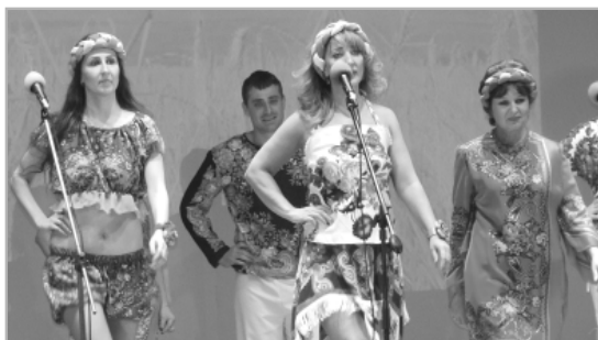
Одной из приятных «изюминок» концерта стало выступление театра моды «Ирина».