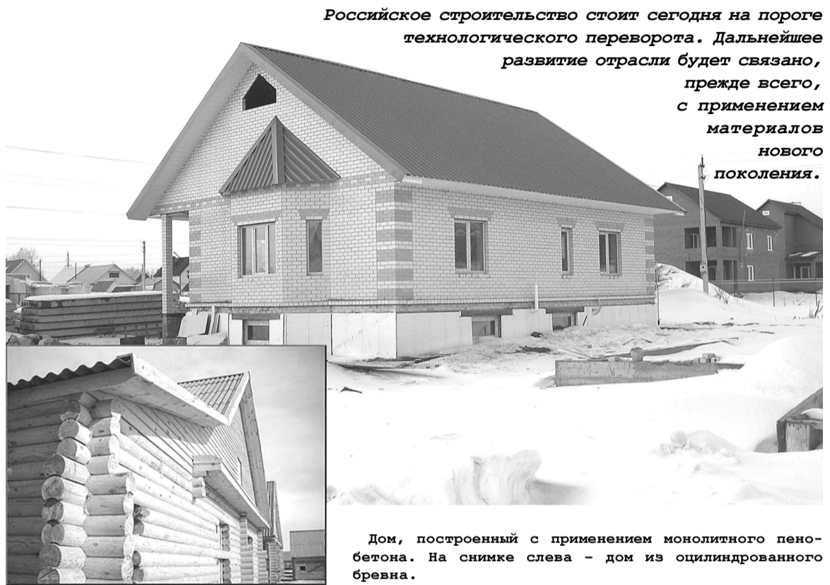
Дом, построенный с применением монолитного пенобетона. На снимке слева – дом из оцилиндрованного бревна.

зованием монолитного пенобетона, обладает повышенной комфортностью при сравнительно небольших затратах на возведение ограждающих конструкций.