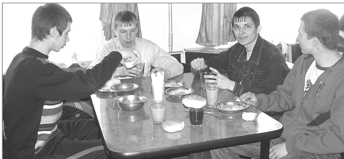
«Перекус» в ТСШ № 1, надо сказать, не слабый!

В среднем стоимость обеда в школьной столовой составляет от пяти до семи рублей. Все школы выращивают на приусадебных