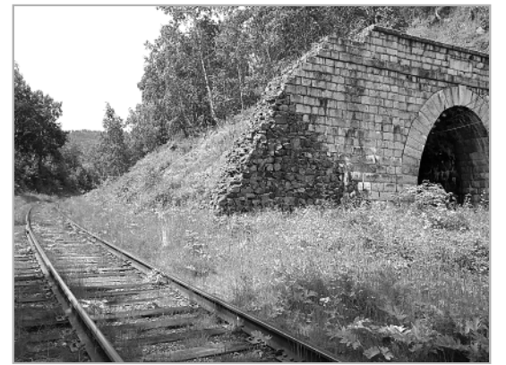
Проходящий по берегу Байкала участок Кругобайкальской железной дороги (КБЖД), построенной еще в 1899-1905 годах, является уникальным памятником инженерного искусства. Значительная часть маршрута прокладывалась в тоннелях, в строительстве которых участвовало более 600 итальянских мастеров.