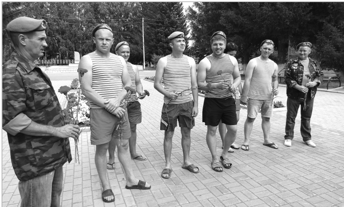
2 августа группа десантников у мемориала Воинской славы отдала дань памяти ушедшим землякам.

ЭТОТ ДЕНЬ бывшие десантники отмечают по-разному, но многих из тех, кто служил в Воздушно-десантных войсках, 2 августа можно встретить на улицах и площадях. Их легко узнать по голубым беретам и тельняшкам, а еще – по наградам, которые блестят на груди. Ведь многие представители славного десанта участвовали в боевых действиях в Афганистане, Чечне и других горячих точках, где они выполняли свой воинский долг.