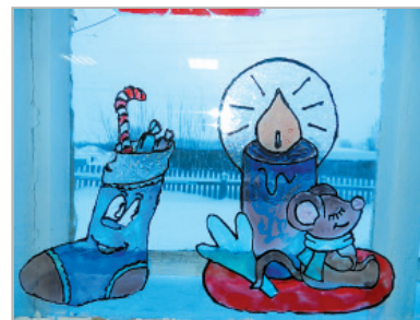
Витражи всегда создают особый уют и погружают в атмосферу праздника. Коллективная работа воспитанников Комплексного центра социального обслуживания населения.