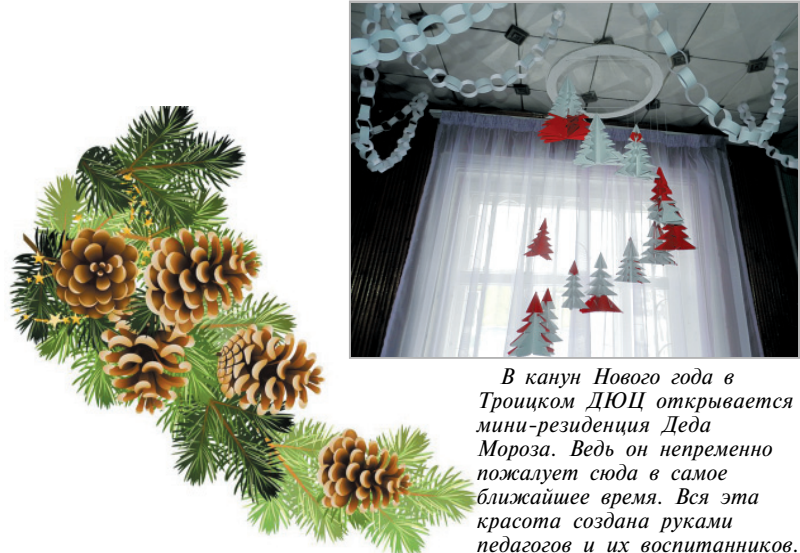
В канун Нового года в Троицком ДЮЦ открывается мини-резиденция Деда Мороза. Ведь он непременно пожелает сюда в самое ближайшее время. Вся эта красота создана руками педагогов и их воспитанников.