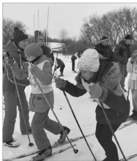
Ежегодные лыжные гонки в Пролетарской школе – это большой праздник для спортсменов.

В самих соревнованиях в этом году приняло участие около 120 человек.