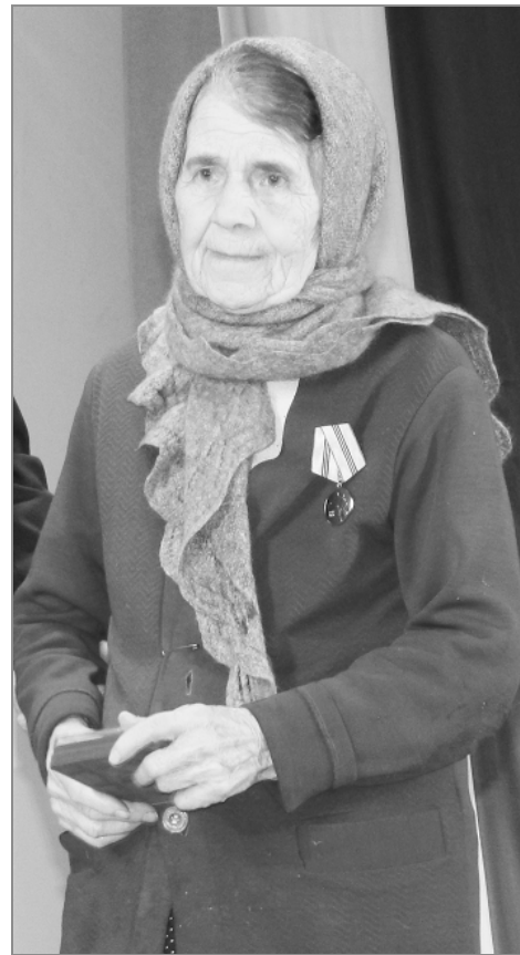
23 февраля на сцене районного Дома культуры состоялось торжественное вручение юбилейных медалей «75 лет Победы в Великой Отечественной войне 1941-1945 гг.».