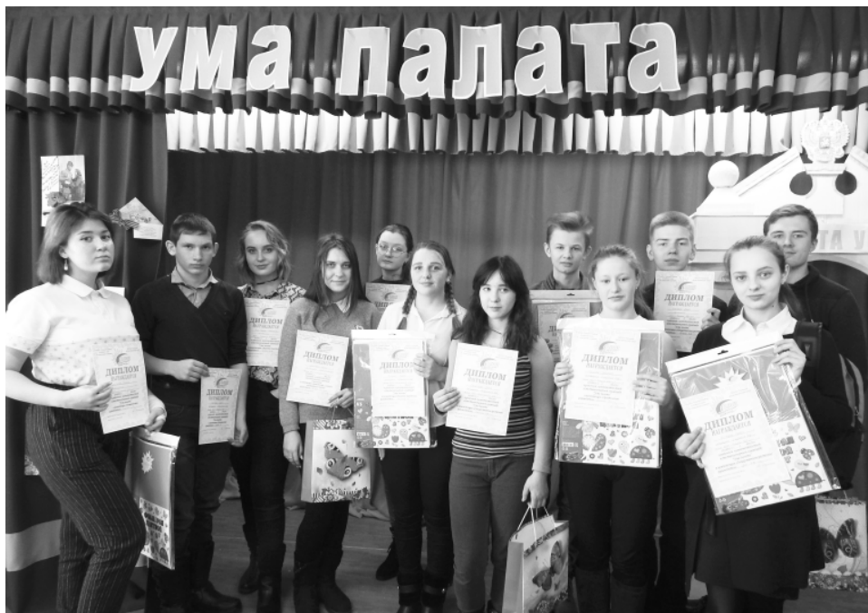
Все победители и призеры награждены дипломами и призами. Победители в каждой компетенции получили приглашение принять участие в окружном этапе олимпиады в Бийске, который состоится 5 марта.