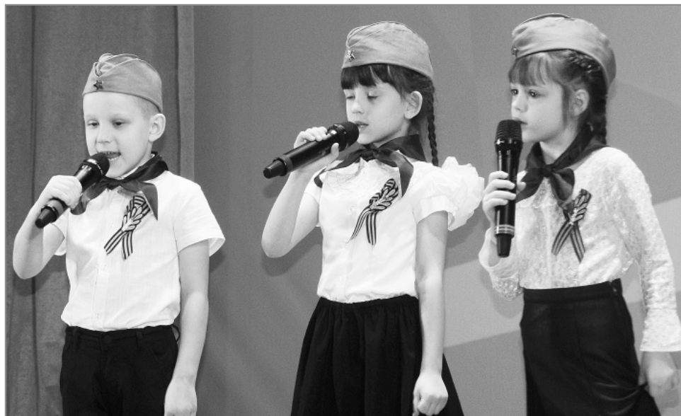
Самые юные участники – воспитанники Троицкого детского сада «Родничок».