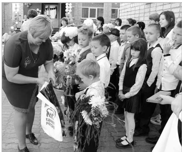
На снимке: 1 сентября в Боровлянской школе.

Вот и осень наступила, учебная пора пришла в каждую школу Троицкого района. Прошли торжественные линейки, посвященные Дню знаний и началу нового учебного года.