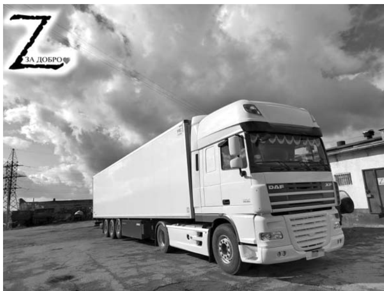
В ближайшие дни фура прибудет к месту назначения.

И, как всегда, после отправки очередной машины с гуманитарной помощью ребятам на передовую начинаем новый сбор и готовимся к следующей! Ребятам по-прежнему очень нужны тепловизоры, приборы