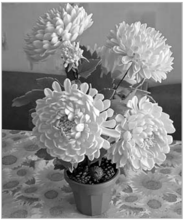
Здесь рождаются ее замечательные поделки, например, вот такие роскошные цветы.

В истории нашей страны никогда не было легких времен, но в этом и проявляется сила русского духа — в любой ситуации хранить самообладание, ценить жизнь во всех ее проявлениях, уметь видеть красоту даже в самых обыденных вещах и быть источником позитива для окружающих, что дано далеко не всем.