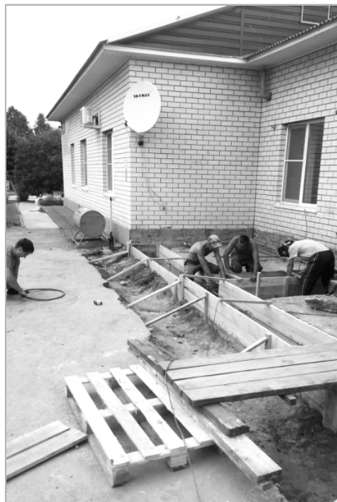
Ремонт крыш, обшивка домов, косметический ремонт – это далеко не полный перечень услуг предприятия.

нашем районе, заказы из близлежащих районов бывают нечасто.