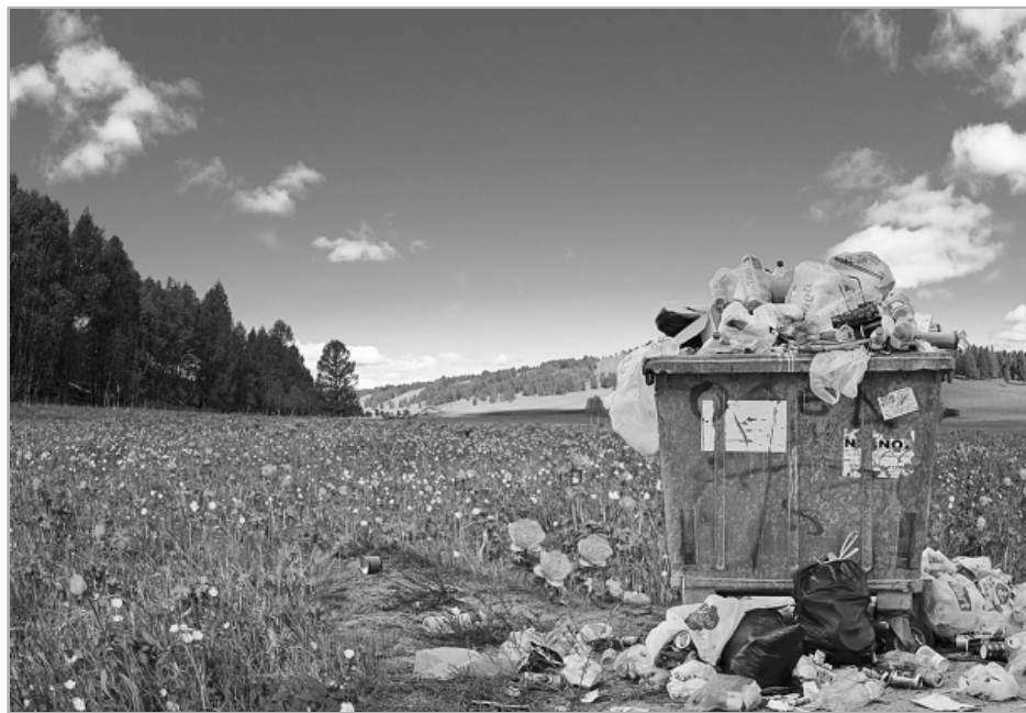
123 несанкционированные свалки выявлены в крае в 2019 году, из них 61 ликвидирована, по данным Минприроды региона.

Калманский район обслуживает самый крупный регоператор — барнаульский «ЭКО-Комплекс». И ему, похоже, удалось найти взаимопонимание с местными властями — администрация района намерена в следующем году приобрести мусорные контейнеры для размещения во всех населенных пунктах. В 15 селах уже есть 29 специ-