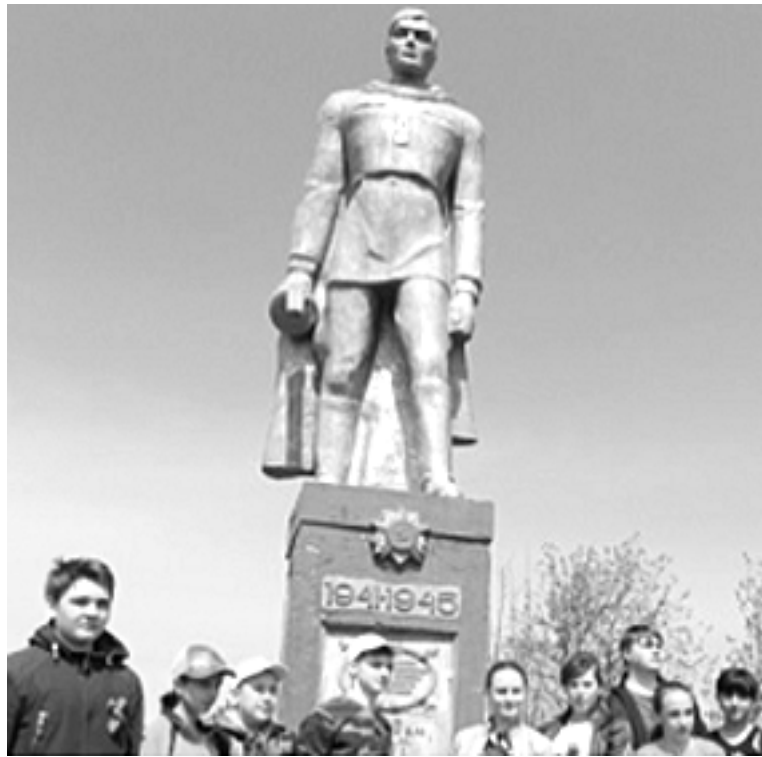
Тридцать лет назад состоялось открытие памятника в Куличьем. Теперь у него собираются только приезжие...